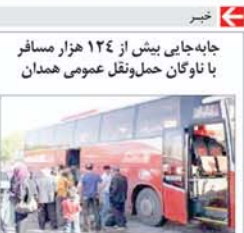
جابه جایی بیش از ۱۲۴ هزار مسافر با ناوگان حمل و نقل عمومی همدان

استاد راهنما همدان با آردی بر کرده نسل تحریک اختصاص کلان در پرونده به عنوان آشنایان با گردو هلال اصرار... تصادفات را افزایش داده است