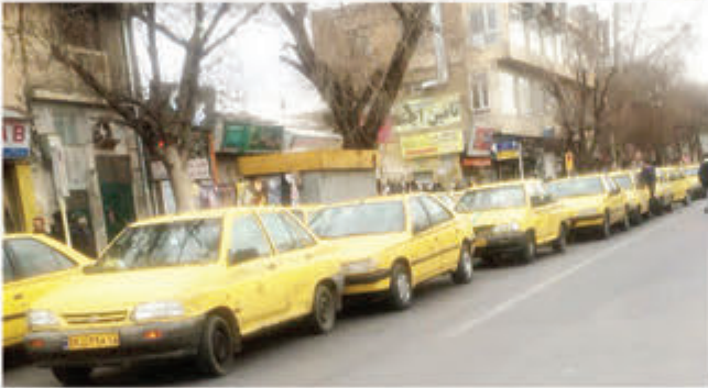
یک صف طولانی تاکسی‌ها در خیابان‌های همدان.

شورای اسلامی شهر همدان و همچنین فرمانداری همدان است را در هفته گذشته تشکیل دادیم و جلسه آینده در همین هفته برگزار خواهد شد که نرخ اصلی نوسط کارشناسان مربوطه در این جلسه پیشنهاد می‌شود.