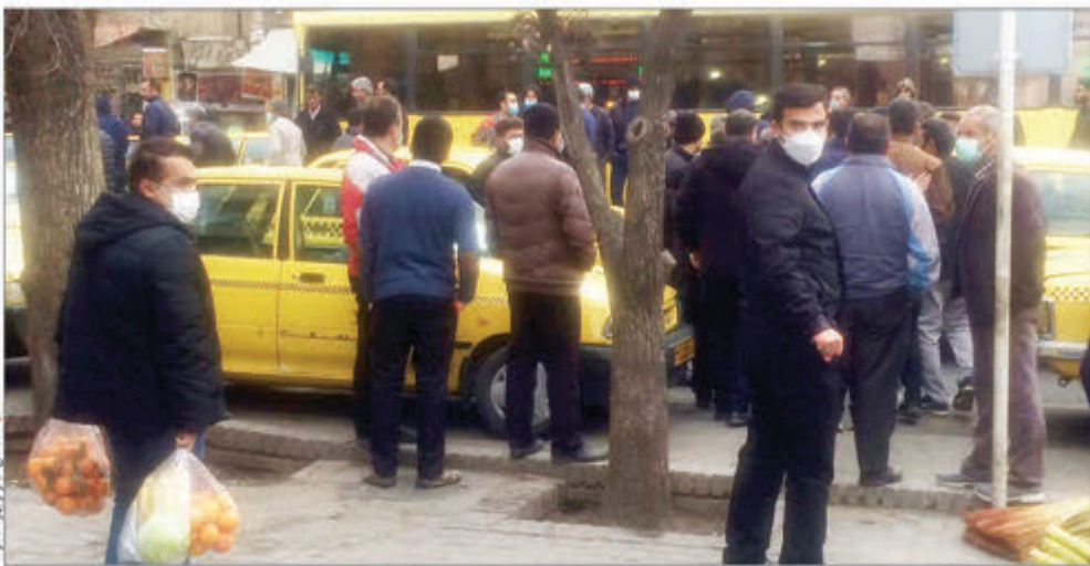
تاکسی‌رانان در اعتراض به نرخ‌گذاری تاکسی‌ها در همدان.