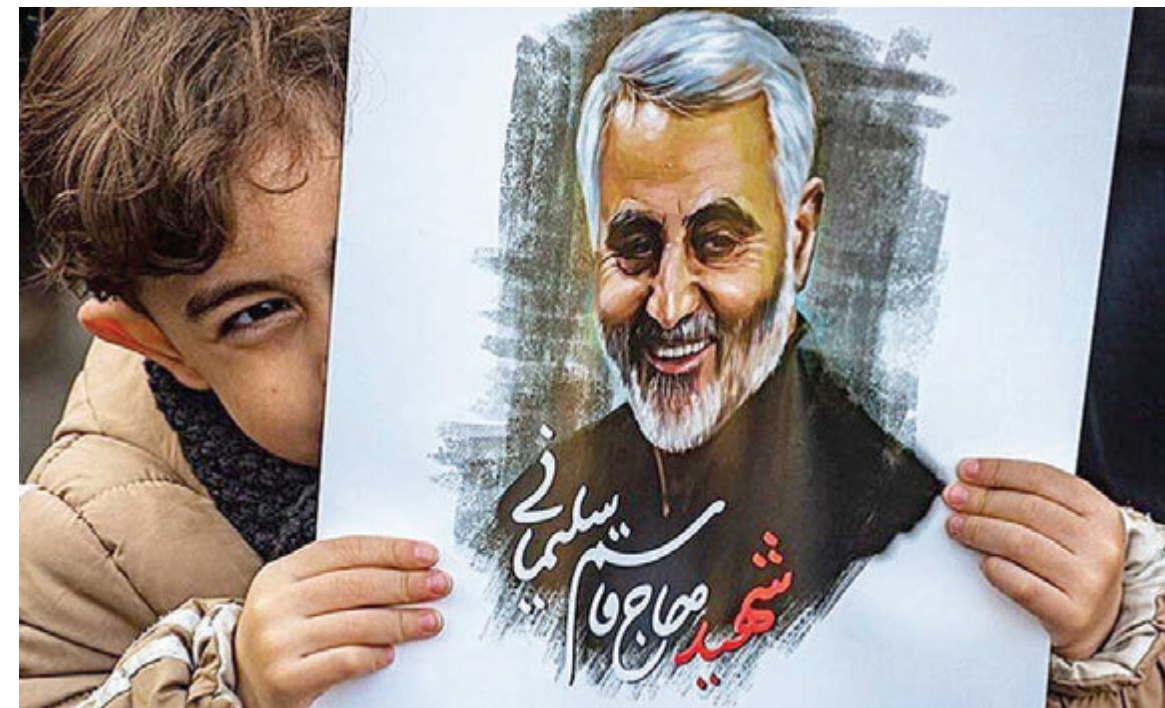
رئیس بنیاد شهید شهرستان همدان: