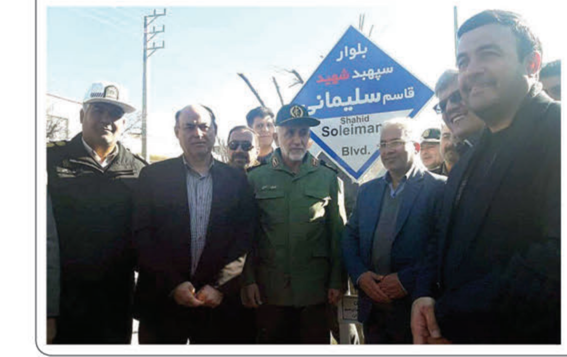
بلوار شهید سلیمانی

شعر سردار سربداران، محفل‌های ادبی همچون ساعت دلتنگی و مراسم بسیار دیگری برای بزرگداشت و آشنایی با مکتب شهید سردار سلیمانی برگزار شده است. همچنین همدان نیز حد فاصله بلوار قاطمیه (زیرگذر بعثت) تا بلوار احمدی روشن (زیرگذر پژوهش) که قبلاً با نام بلوار بعثت شناخته می‌شد، به نام شهید سردار سلیمانی نام گذاری شده است. گفتنی است که طبق گفته مهدی ظفری مدیرکل بنیاد حفظ آثار و نشر ارزش‌های دفاع مقدس، اسفند ۱۸۰ برنامه ویژه برای ساگرد شهادت سردار سلیمانی در همدان برگزار خواهد شد. اسفند ۱۳ دی ۱۳۹۸ درحمله موشکی پهپادهای آمریکایی، سردار سلیمانی فرمانده نیروی قدس سپاه پاسداران، ابومهدی المهندس معاون نیروی مردمی عراق (الحشد الشعبي) و همراهانشان به شهادت رسیدند. این حمله با دستور مستقیم رییس جمهوری آمریکا انجام شد.