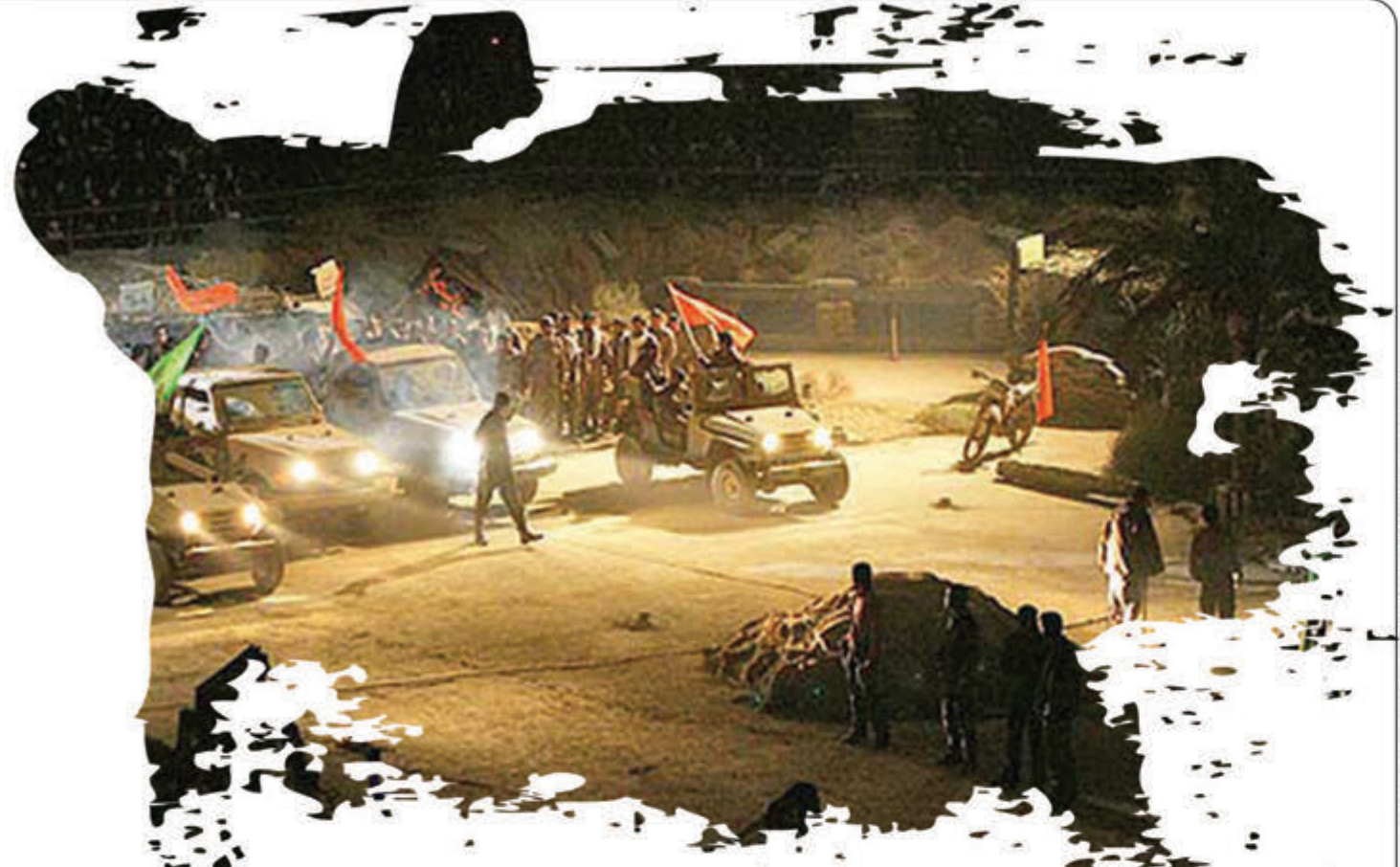
صحنه سازی دفاع مقدس در نخستین یادواره ۸۰۰۰ شهید استان همدان