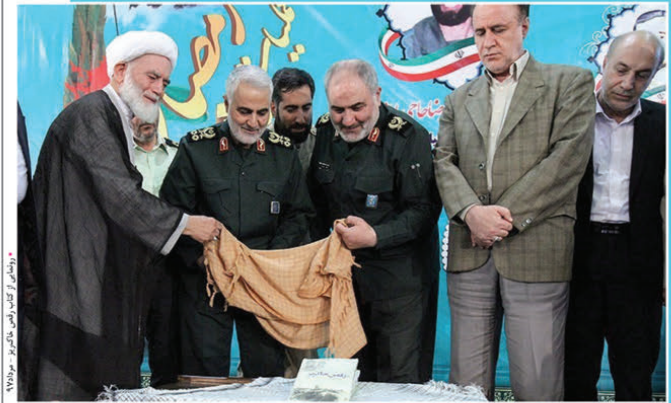
رومعی از کتاب رقص خاکبیز - مرداد ۹۷

سردار قاسم سلیمانی فرمانده نیروی قدس سپاه پاسداران دفاعی قبل برای شرکت در نخستین یادواره شهدای استان همدان در عملیات رمضان وارد همدان شد. این عبارتی بود که صبح روز پنجشنبه چهارم مردادماه ۱۳۹۷ روی خروجی‌های خبرگزاری‌های کشور به ویژه رسانه‌های همدان رفت. در آن زمان هیچ فردی انتظار نداشت که یکی از سخنران‌ها مهم تاریخ ایران اسلامی قرار است تا دفاعی دیگر در دارالمجاهدین انجام شود. سخنرانی که این روزها برخی از دوستان سردار دلها به عنوان پیشواز در گوشه‌های خود استفاده می‌کنند، برنامه اصلی حاج قاسم حضور در یادواره شهدای استان همدان در عملیات رمضان بود.