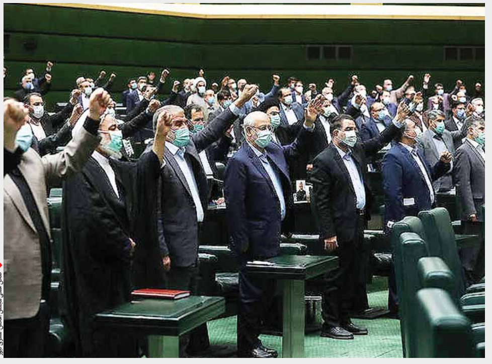
مجلس شورای اسلامی در جلسه علنی روز شنبه ۱۳ خردادماه ۱۴۰۱

وی با تأکید براینکه گرانی‌ها هیچ توجیهی ندارد و مجلس هم از جایگاه نظارتی خود پیگیر این موضوع است. وی در پایان، ضمن تشکر از مردم خوب شهرستان ملایر، گفت: بنده اگر قرار باشد که در آینده در این مسیر قدم بردارم، نیازی به تبلیغ ندارم چرا که همه اقشار مختلف مردم ملایر من را می‌شناسند و دو دوره به من اعتماد کردند و بنده رأی دادند و من هم به رسم امانت داری تمام تلاش خود را در پیشبرد اهداف شهرستان و مردم انجام دادم و مهم‌ترین دستاورد ما نیز در این دو دوره ثبت جهانی ملبمان و مثبت‌بوم چنین ثبت جهانی انگور ملایر بود که با پیگیری نمایندگان محقق شد.