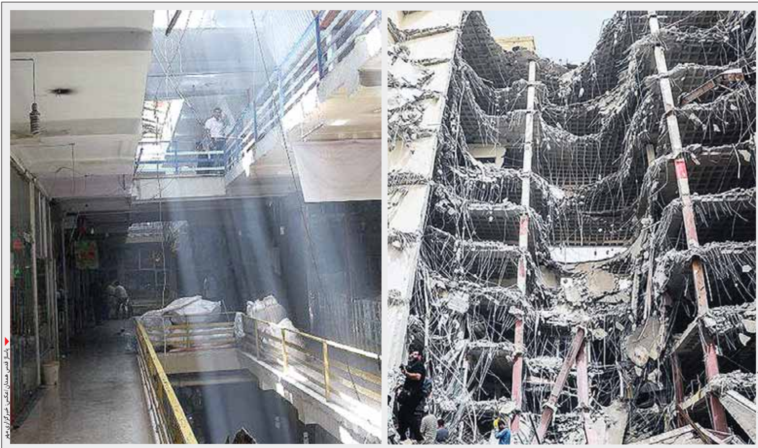
تخریب متروپل در همدان.

۱۲ ساعت ۲۰مین دومین روز خرداد در یکی از مناطق شلوغ آبادان یکی از برجهای دو قلو متروپل فروریخت. حادثه ای که باعث مدفون شدن و جان باختن تعدادی از هموطنان شد و یادآور حادثه آتش سوزی و فرو ریختن پلاسکو در سال ۹۵ بود که منجر به شهادت آتش نشان ها شد. متروپل هنوز به بهره برداری کامل نرسیده بود اما در گذشته اخطارهایی مبنی بر داشتن ایرادات مختلف در این ساختمان گزارش شده بود که مورد بسی توجهی قرار گرفت در خصوص ساختمان پلاسکو در تهران هم پیشتر به آن اخطارهایی درباره عدم ایمنی در تاسیسات اطفای حریق داده شده بود که به آن توجه نشد. نایبمنی ساختمان ها و مراکز تجاری در همدان هم مطرح است. پاساژ های قدس، استقلال، ایران و همچنین بافت قدیمی بازار هم در برابر آتش سوزی ایمنی لازم را ندارند. در این میان پاساژ قدس یکی از حادثه خیزترین نقاط بازار همدان است که به دلیل همجواری با راسته بازارهای مهم مثل نخود بریزها، کفاح ها و قندها بسیار حادثه خیز است و در صورت بروز آتش سوزی با مشکلات عدیده ای برای امداد رسانی مواجه می شود. هم اکنون به دلیل ترافیک بالا ورود آمبولانس، ماشین های آتش نشانی و خودروهای امدادی به داخل بازار امکان پذیر نیست. بازار همدان بر اساس طراحی شهر در مرکز شهر قرار گرفته و از بافت قدیمی مربوط به دوران قاجاریه برخوردار است و بسیاری از ساختمانها، دالانها و کوچههای این بازار در فهرست آثار ملی ثبت شده و تحت نظارت سازمان میراث فرهنگی قرار دارد که نیازمند مراقبت و توجهات است تا بتواند از آسیب های احتمالی در امان باشد. برج سازی های مختلف و مجتمع های تجاری در همدان است که از ابتدا چندجناح