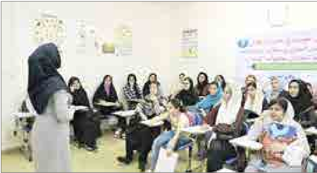
جلسه آموزشی مدیریت بحران گروه دوام

▪ کارشناس مدیریت بحران شهرداری همدان در گفت و گو با همدان پیام: گروه دوام باید در همه محله ها تشکیل شود