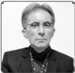
صفحه فرهنگ و ادب زیر نظر: میر مسعود حاکم زاده