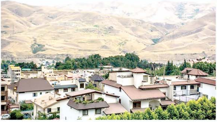
نمایی از کوهپایه الوند از دست رفت

افزایش کوهپایه الوند از دست رفت مقاله مدرسه تیزهوشان مجروحانست دارد که مالکان قدیمی محسوب می‌شوند و باقی آنها اخلاف‌ساز هستند. در حالی که مالکان جدید نیز به تازگی و در پی احداث پروژه‌های مسکونی در مجاورت کوهپایه الوند از دست رفتند و در شرف ساخت هستند. مالکان قدیمی این منطقه به دلیل خرید زمین در زمان قدیم و ساخت خانه‌ها در آن زمان می‌توانند به این منطقه به عنوان زمین حاصل خود نگاه کنند. اما مالکان جدید که در پی احداث پروژه‌های مسکونی در مجاورت کوهپایه الوند از دست رفتند و در شرف ساخت هستند، خواهان خرید زمین در این منطقه هستند و این امر می‌تواند به کاهش قیمت زمین در این منطقه منجر شود. مالکان قدیمی این منطقه به دلیل خرید زمین در زمان قدیم و ساخت خانه‌ها در آن زمان می‌توانند به این منطقه به عنوان زمین حاصل خود نگاه کنند. اما مالکان جدید که در پی احداث پروژه‌های مسکونی در مجاورت کوهپایه الوند از دست رفتند و در شرف ساخت هستند، خواهان خرید زمین در این منطقه هستند و این امر می‌تواند به کاهش قیمت زمین در این منطقه منجر شود.