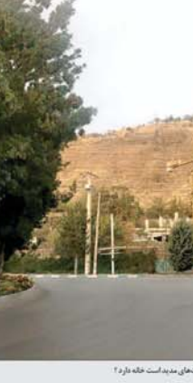
کلیه عیدهای همدان در مسیر راه آهن قرار می‌گیرد.

آمار تهیه شده توسط وزارت فرهنگ و گردشگری چین در سه روز اول هفته طلایی، پداری ۳۹۵ میلیون مسافر داخلی بود که ۷۵۸ درصد نسبت به مدت مشابه سال گذشته، ۲۹۲٫۲۴ درصد افزایش یافته است.