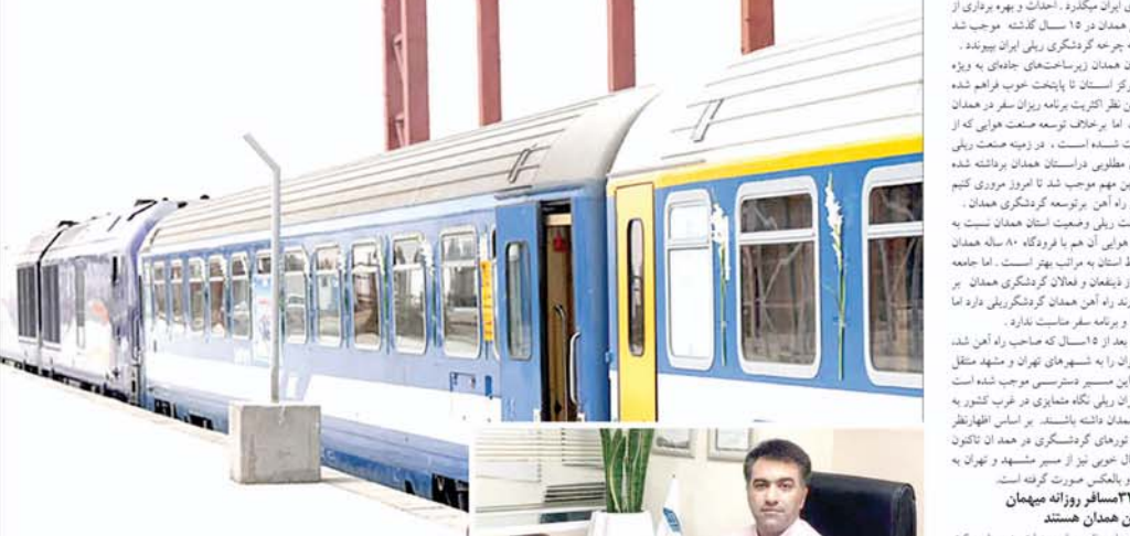
کلیه عیدهای همدان در مسیر راه آهن قرار می‌گیرد. این قطار در مسیر تهران-همدان قرار دارد.

رئیس انجمن خدمات مسافرتی همدان: جاده راه آهن نه زیباست نه امن