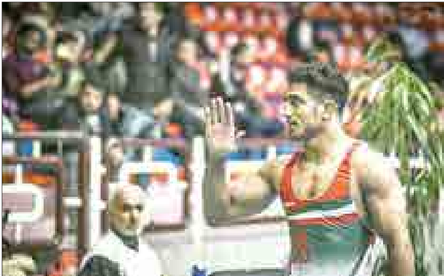
بازیکنان تیم فوتبال شهرداری همدان در جریان بازی با تیم فوتبال گسترش سوزشکاران همدان در ورزشگاه شهید صدوقی همدان.

رئیس کشتی همدان حالا به ساحل آرامش رسیده و درست است که با مازندران هنوز فاصله زیاد دارد، اما در میادین مهم همچون قهرمانی کشور و انتخابی تیم ملی ، استان‌های دیگر به همدان به چشم یک رقیب قابل احترام نگاه می‌کنند.