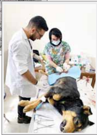
فرجی گفت: فرجی در ادامه از اجرای دقیق دستورالعمل کنترل جمعیت سگهای ولگرد خبر داد و افزود: قریب به دو سال قبل پیمانکاری از طریق تشریفات قانونی و مناقصه انتخاب و هم اکنون با درخواست شهروندان اقدام به جمع آوری سگها از سطح شهر و محلات و انتقال به پناهگاه می کند و نیز در این ارتباط سعی شده است کلیه نکات مندرج در دستورالعمل به مورد اجرا درآید.

شهردار ملایر همچنین از تجهیز محل پناهگاه خیرداد و گفت: پس از احداث ساختمان جدید در پناهگاه برای استقرار کادر دامپزشک و کارشناسان ذریبط ، اتاق عمل پناهگاه مجهز به انواع تجهیزات مورد نیاز دامپزشک گردید و داروهای مورد لزوم برای درمان سگهای ولگرد اعم از انواع واکسن و داروهای تخصصی ، داروی بیهوشی و ... از طریق شهرداری خریداری و در اختیار تیم درمان قرار گرفت.