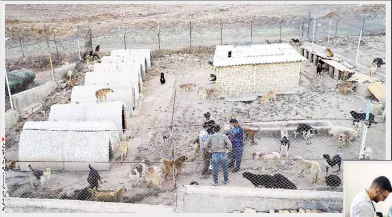
مرکز نگهداری سگ های ولگرد در ملایر

افزایش بی رویه جمعیت سگهای ولگرد پیرامون شهرها و روستاهای کشور و ممنوعیت کشتنار و حذف فیزیکی این حیوان و همچنین توجه به وجود انواع بیماری مشترک بین انسان و سگ و احتمال شیوع این بیماریها در مجامع انسانی ، در پاییز سال ۱۳۸۷ دستورالعمل کنترل جمعیت سگهای ولگرد با هدف اجرایی نمودن بند ۱۵ ماده ۵۵ قانون شهرداریها ، از طریق سازمان شهرداریها و دهیاریهای کشور به کلیه شهرداریها ابلاغ و عمل کارگروه انسانی و شهرستانی کنترل جمعیت حیوانات ناقل بیماری به انسان قرار گرفت.