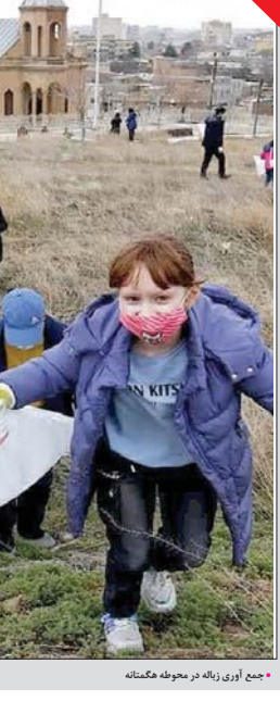
جمع آوری زباله در محوطه گمناخته