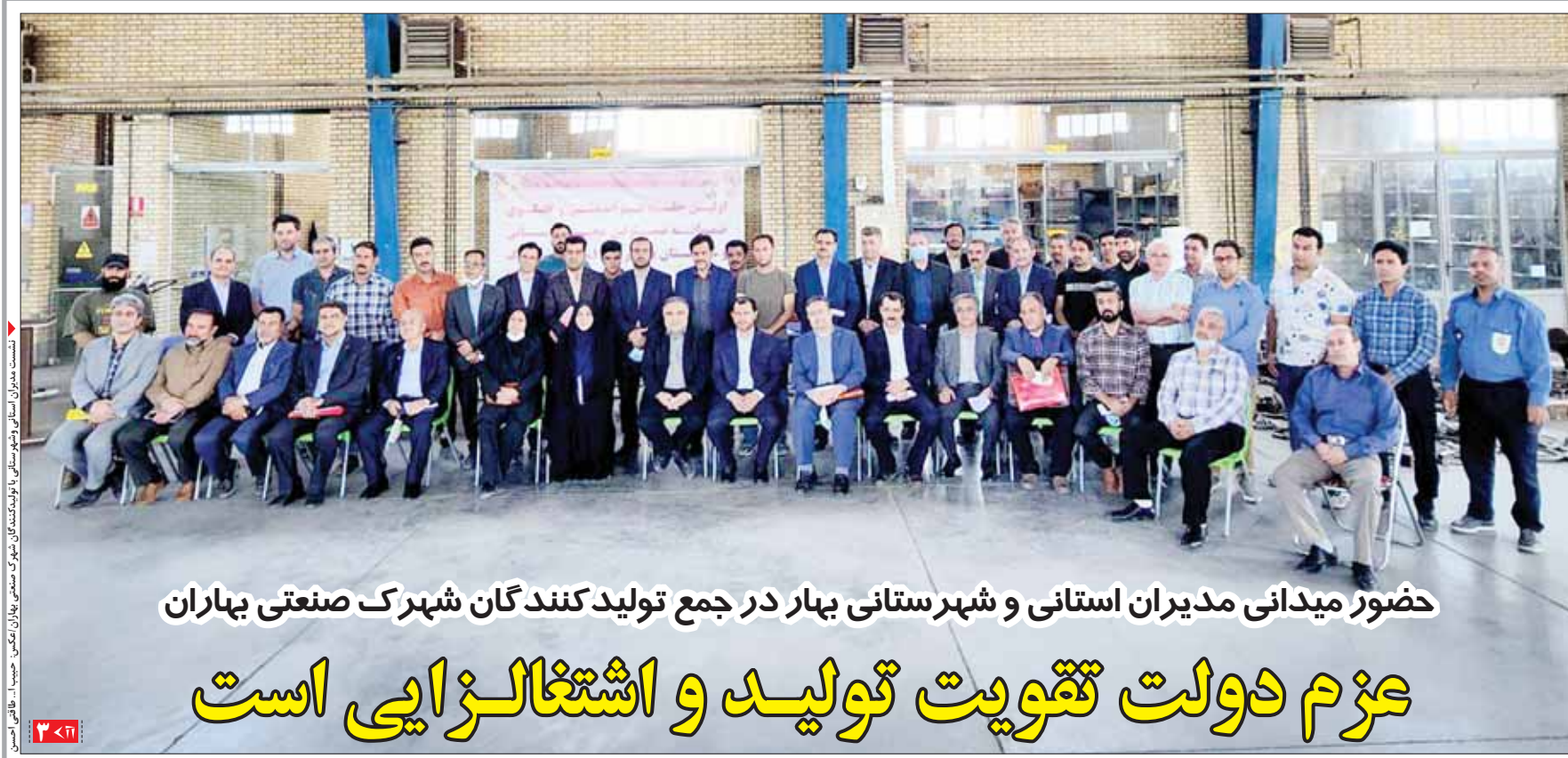
حضور میدانی مدیران استانی و شهرستانی بهار در جمع تولیدکنندگان شهرک صنعتی بهاران