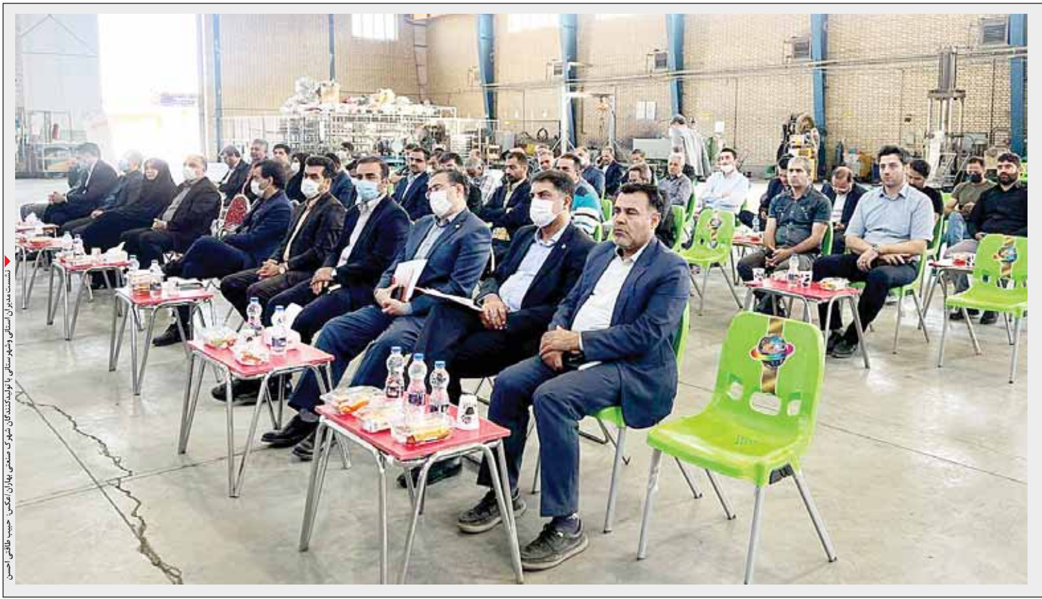
حضور مدیران استانی و شهرستانی بهار در جمع تولید کنندگان شهرک صنعتی بهاران

بهار - مینابراهیمی - خبرنگار همدان پیام: نشست مدیران استانی و شهرستانی بهار با تولید کنندگان شهرک صنعتی بهاران به دعوت و محوریت فرماندار بهار با هدف بررسی مشکلات در شرکت پترونوار مستقر در شهرک صنعتی بهاران برگزار شد.