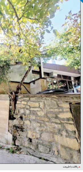
مکان همدان پیام