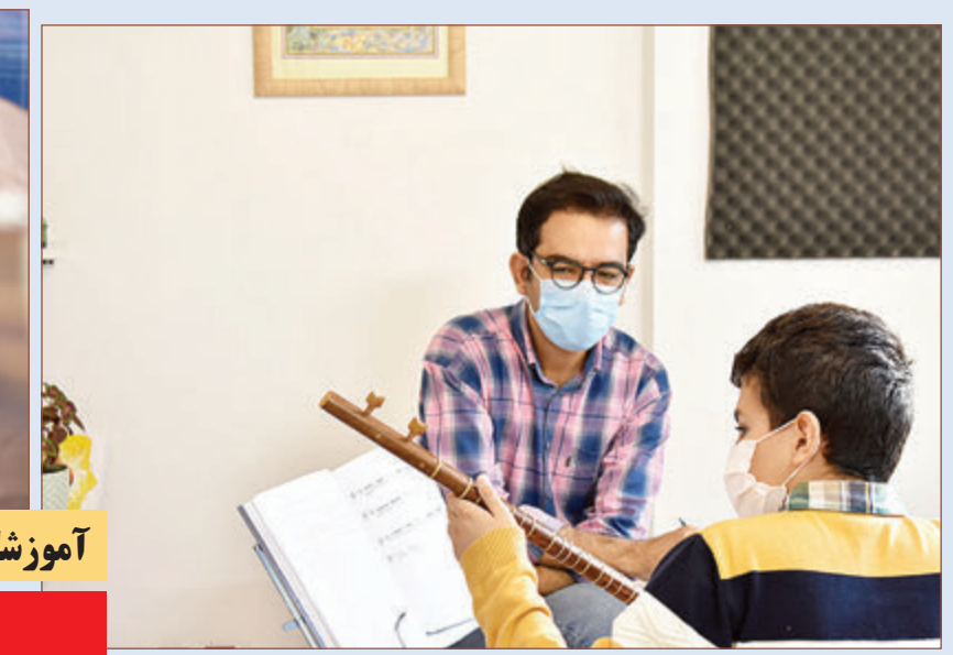
آموزشگاه موسیقی ارغنون از علاقه‌مندان به هنر موسیقی هنرجو می‌پذیرد