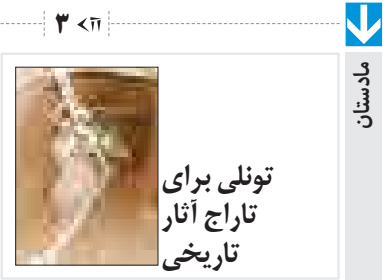
تونلی برای تاراج آثار تاریخی