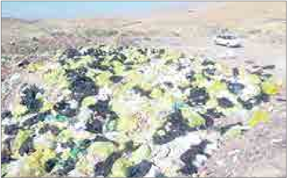
۲۲رشته‌سازان نِهَوَند: ۲۲تیموسازی نِهاوند برگزار کرد