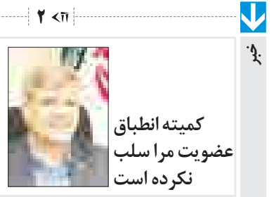
کمیته انطباق عضویت مرا سلب نکرده است