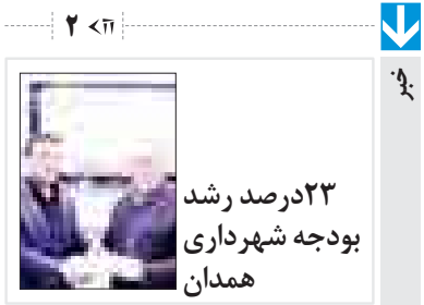
۲۳ درصد رشد بودجه شهرداری همدان