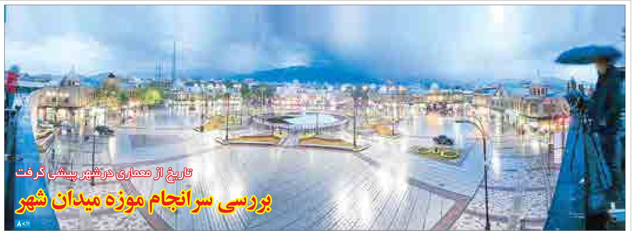
تاریخ از معماری در شهر پیشی گرفت بررسی سرانجام موزه میدان شهر

■ نجفی مقدم در سکوت خبری جایگزین خشوعی شد