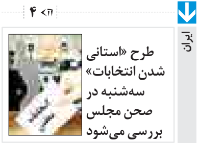
طرح «استانی شدن انتخابات» سه‌شنبه در صحن مجلس بررسی می‌شود