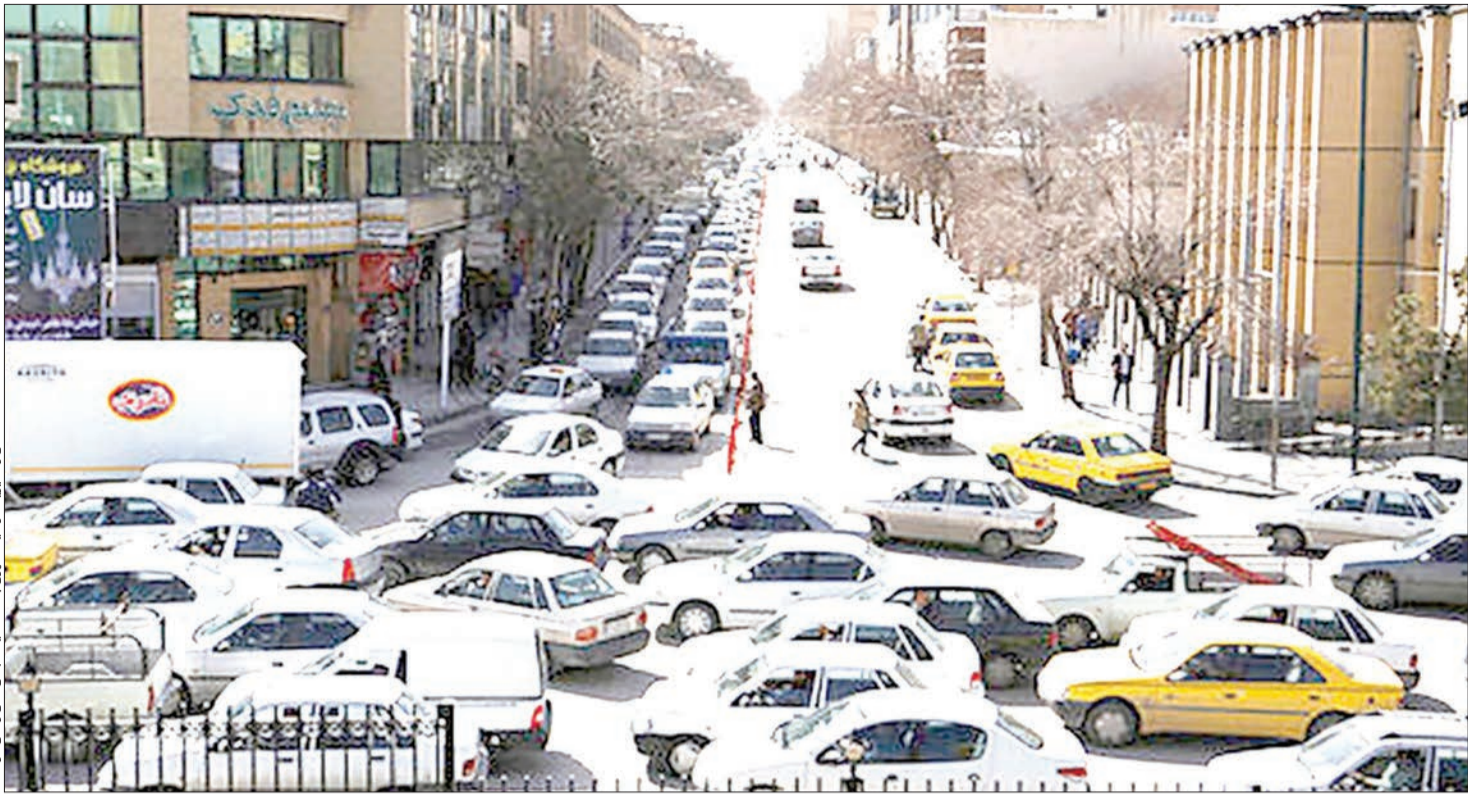
ساخته‌های و غیرانتفاعی مدارس و مؤسسات آموزشی که بیشتر آنها را مراکز غیردولتی و غیرانتفاعی تشکیل داده است سبب ایجاد صف‌های طولانی و ترافیک سنگین در خیابان‌ها و بلوارهای شهر شده است.

از اماکن پر ترافیک به کجا رسید؟ در همین راستا دی ماه سال گذشته بود مصوبه‌ای در همین جلسه شورای حمل‌ونقل ترافیک شهرستان اعلام شد که فرماندار خواستار پیگیری هر چه سریعتر وضعیت جانمایی مدارس در حوالی میدان بعثت شد و تأکید کرد که سال تحصیلی جدید باید به فکر مکان دیگری برای جانمایی این مدارس باشیم زیرا جانمایی نادرست این فضاهای آموزشی یکی از عوامل اصلی ایجاد گره ترافیکی در شهر هستند؛ مدارس غیردولتی واقع در حاشیه معابر و بلوارهای پرتراffic شهر همدان تا پیش از آغاز سال تحصیلی جدید باید جابه‌جا شوند اما به نظر می‌رسد هنوز اقدامی از سوی مسئولان مربوطه صورت نگرفته است و گویا قرار است امسال هم شاهد گره‌ای ترافیکی در این مناطق باشیم. همچنین یکی دیگر از عوامل اصلی ترافیک شهر تردد خودروهای تک‌سرنشین است که بسیاری از والدین به دلیل کمبود سرویس مدارس ویا هزینه بالای آن ترجیح می‌دهند خودشان فرزندانشان را با خودرو شخصی به مدرسه ببرند. از همین رو کارشناسان و مسئولان بارها بر این موضوع تأکید کرده‌اند که در این ایام بهتر است دانش‌آموزان و