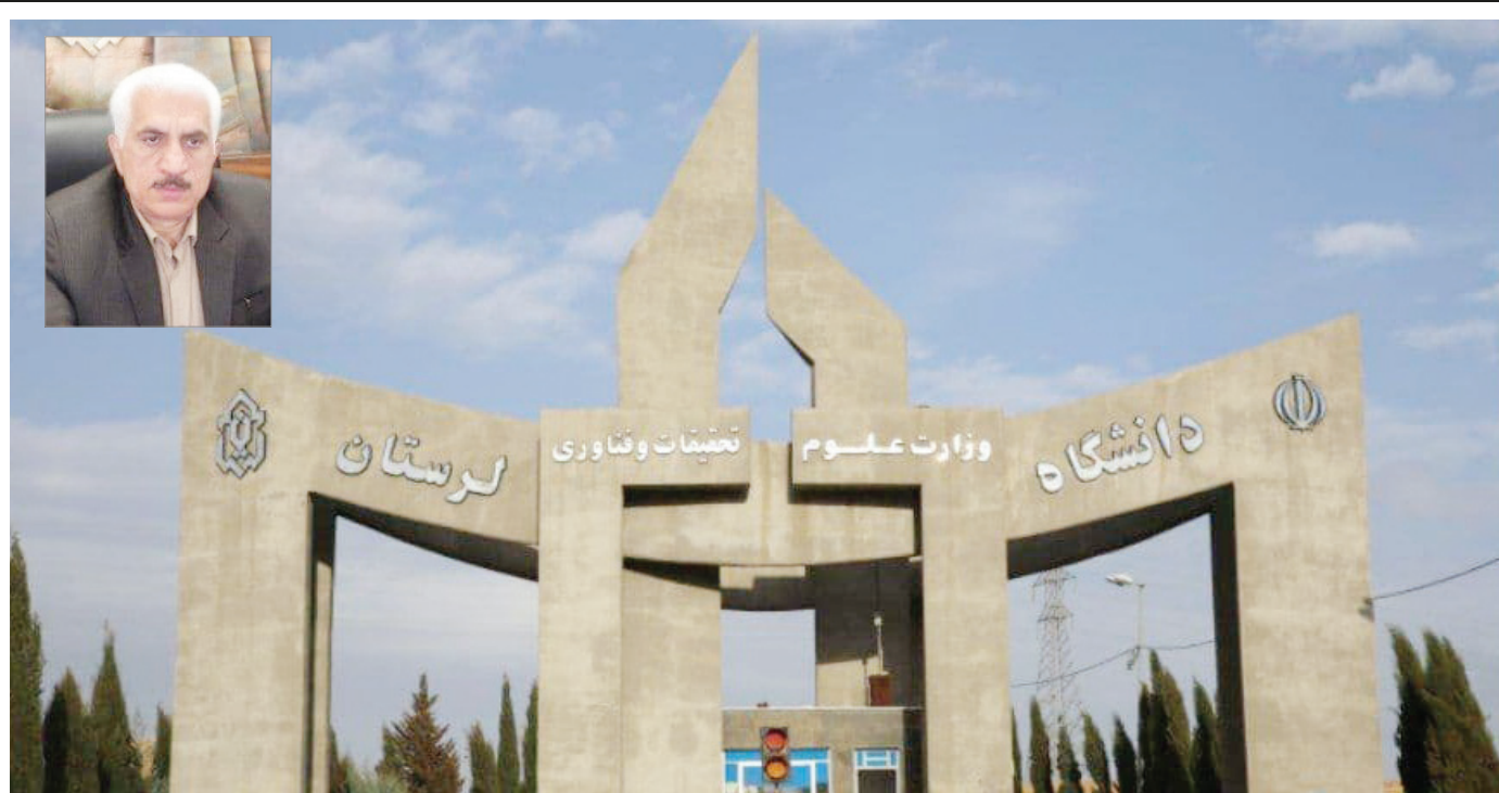
دکتر عزیزی در نشست مجازی با رسانه ها