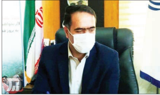
فجر امسال آماده بهره‌برداری شدند که یکی از این تعداد پروژه‌ها که امروز به افتتاح رسید چمن مصنوعی کاسیان بود.

به مساحت یک هزار متر مربع در روستای کاسیان بیران شهر کلنگ‌زنی شد که در اسفند ۹۹ به بهره‌برداری رسید. مدیرکل ورزش و جوانان لرستان خاطر نشان کرد: اعتبار هزینه شده برای این طرح ۷۵۰ میلیون تومان از محل تامین اعتبار ملی است که به کارفرمایی اداره کل ورزش و جوانان لرستان و توسط شرکت آسیا چمن به بهره‌برداری رسید و دفتر فنی اداره کل ورزش و جوانان لرستان دستگاه ناظر بود.