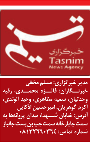
مدیر خبرگزاری: مسلم مخفی