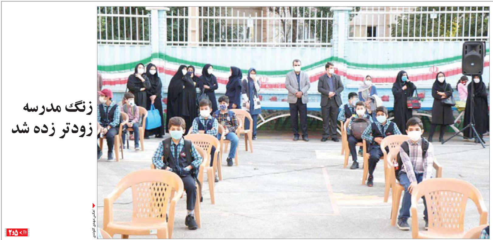
زنگ مدرسه زودتر زده شد