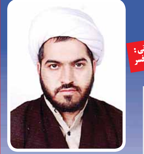
نامزد انتخاباتی: محمد مهدی افسر