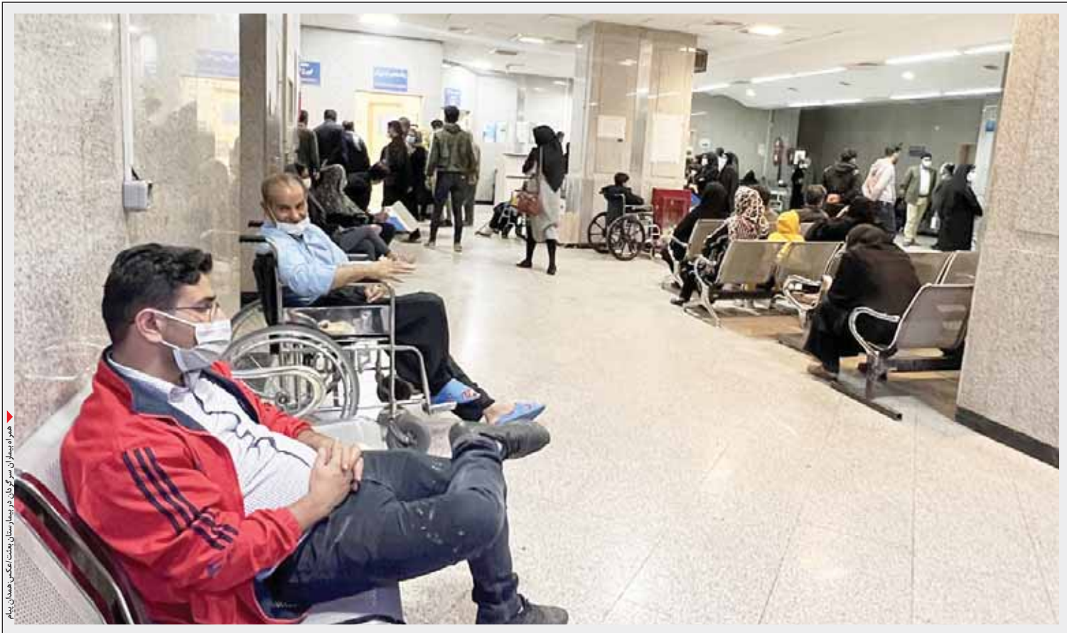
همراه سرا در کنار بیمارستان شهید بهشتی همدان

بی سرپناهی همراهان بیمار هنوز نتوانسته چشم مسئولان را به خود خیره کند