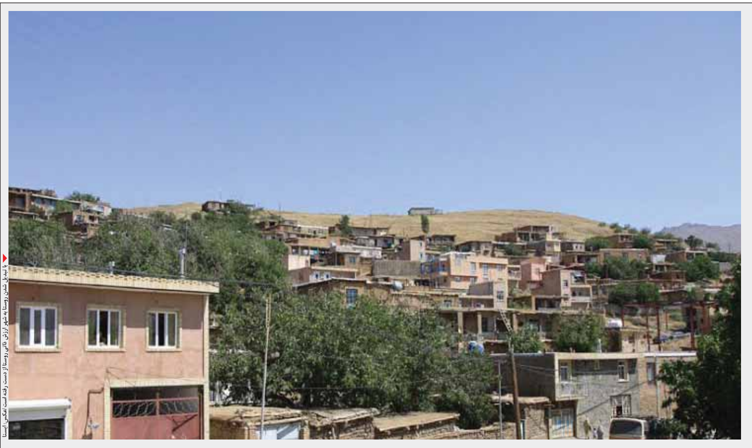
این تصویر نشان‌دهنده روستاهای اطراف شهر رزن است که در حال تبدیل شدن به شهر هستند.

■ با شهر شدن روستاها اشتغال روستاییان از بین رفت