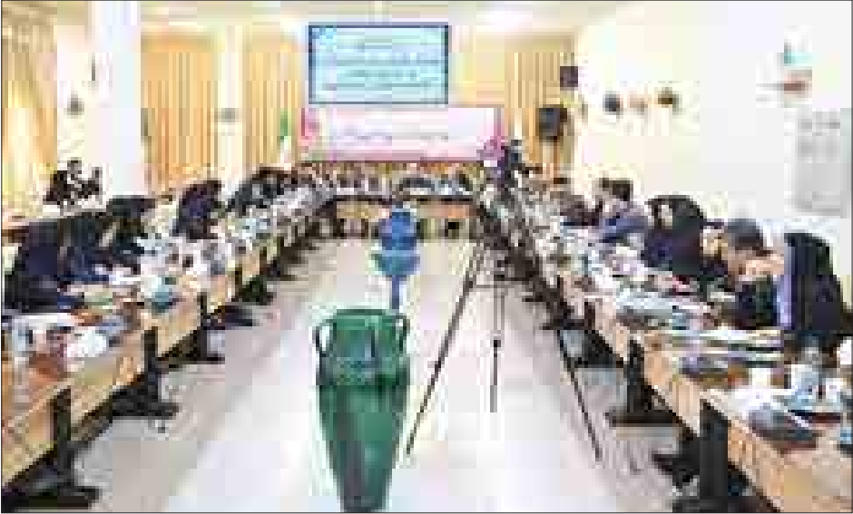
« مسانه جهانگیری عرض

۱ هفته دولت آغاز شده است هفته‌ای که امسال با رویداد ملی ۲۰۱۸ یعنی میزبانی همدان در کنفرانس همدان پایتخت گردشگری آسیا تلیفیک شده و مسئولان را از مدتها قبل به تکاپو وا داشته است.