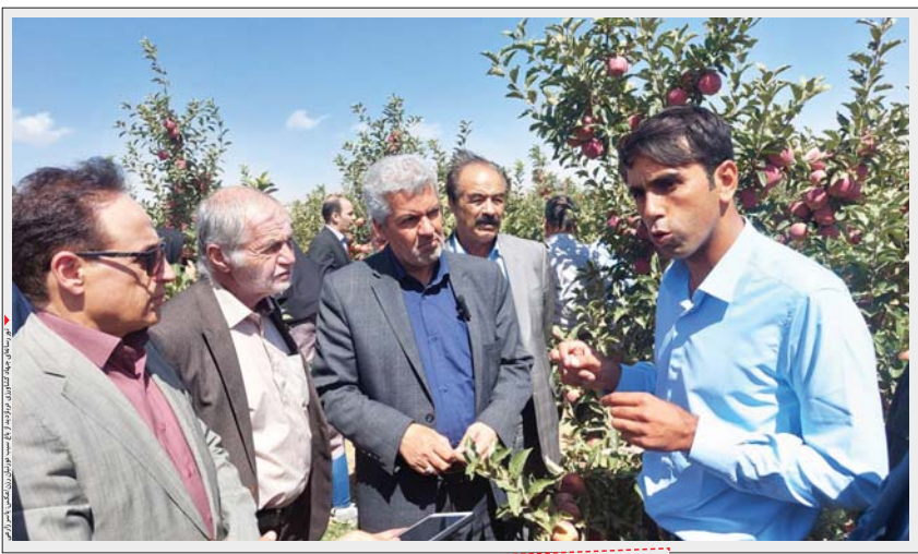
رئیس جهاد کشاورزی استان در بازدید از باغ شیخلر همراه با مدیران و کارشناسان جهاد کشاورزی استان.

مجموعه باغ شیخلر نمونه کشت صحیح مکانیزه خلیوارده ای که در تهران کارخانه تولید مواد غذایی داشتند پس از انقلاب به دستور امام (ره) به روستا بازگشتند و کارخانه تولید مواد غذایی را در روستا و شهر اما پس از گذشت زمان ۱۵ هزار هکتار زمین روستا را یکپارچه کردند تا کشاورزان روستایی دورتایان موفق در حوزه پرورش سیب موفق شوند و امروز محصولات دروازه شیخلر که متولد دهه ۶۰ است، دارای کارخانسی رشد حدود ۳ هزار هکتار و بازرای نمونه خلیج فارس نیز می باشد.