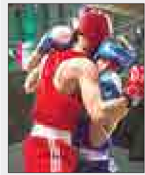
ورزشکاران همدانی تاجدار المپیاد استعداد های کشور