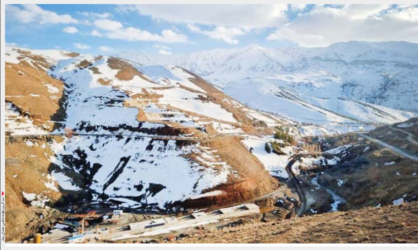
پروژه سد گرین در مالزی

معومه کمالوند نهند، خبرنگار همدان پیام: از سال ۹۰ که عملیات اجرایی سد گرین نهند آغاز شد تا امروز اجرای این پروژه که عنوان آرزوی دیرینه نهندیها را با خود یکدست می‌کشد، نزدیک به ۲۰ سال می‌گذرد، پروژهای برای حیات کشاورزی و آب در شهرستانی که به نام شهر سراب ها معروف است.