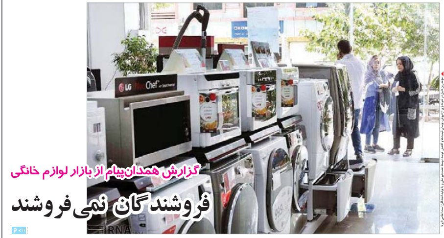
گزارش همدان پیام از بازار لوازم خانگی فروشندگان نمی‌فروشند