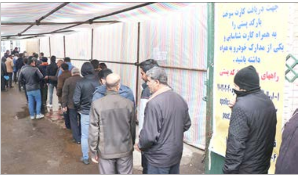
جمعیت درانتظار کارت سوخت

است که سهمیه اضافه داشته باشد و نه چون مجرد است می‌تواند به‌چرخه سروس‌های مدارس وارد شود بنابراین لیتر آزاد بنزین تمامی افرادی که صاحب خودرو هستند در یک موع واکنشی اقتصاد که دامگیر جامعه شده است واکنش نشان داده و به عبارتی مجبور