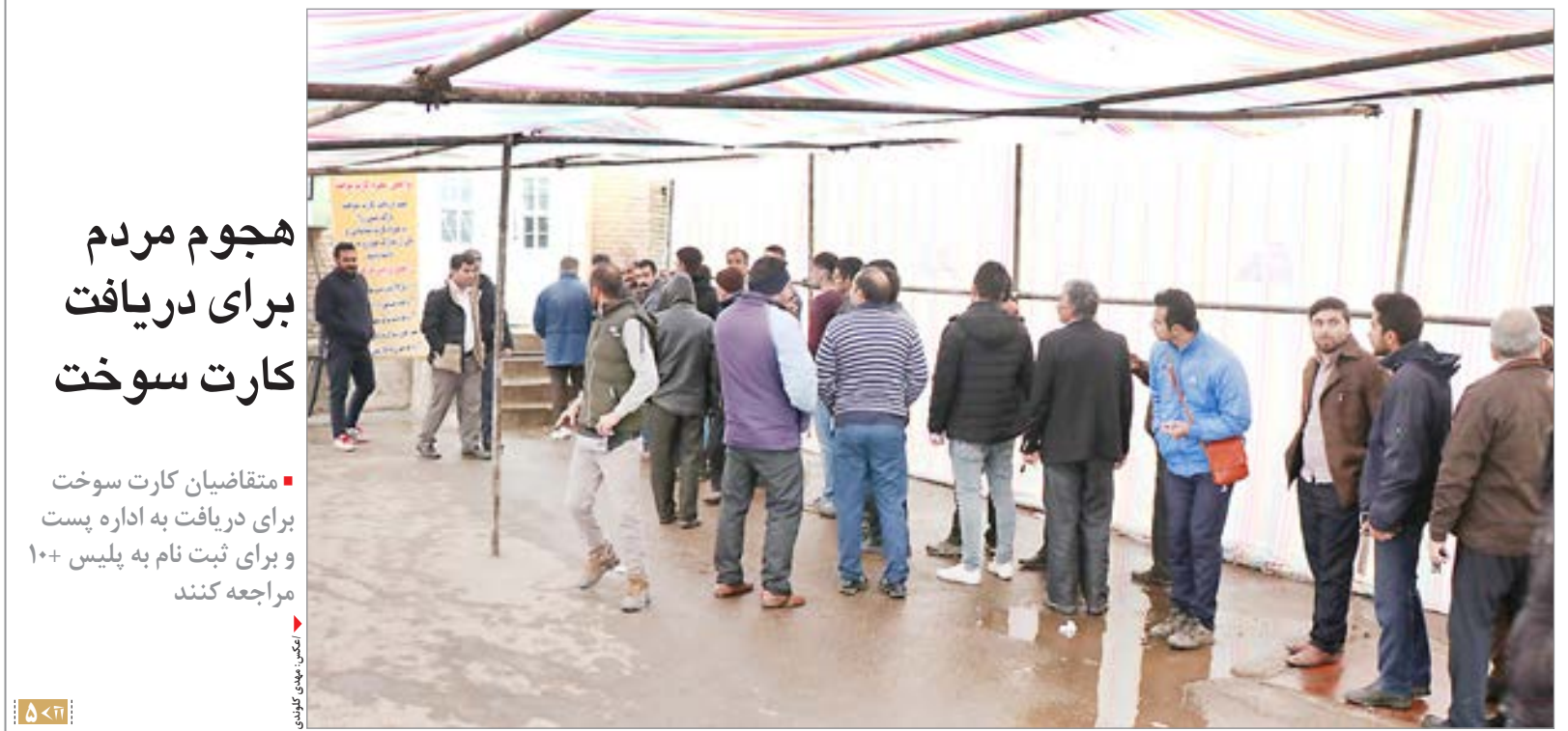
هجوم مردم برای دریافت کارت سوخت

متقاضیان کارت سوخت برای دریافت به اداره پست و برای ثبت نام به پلیس +۱۰ مراجعه کنند متقاضیان کارت سوخت برای دریافت به اداره پست و برای ثبت نام به پلیس +۱۰ مراجعه کنند