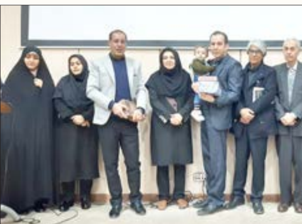
پیام‌تاریخ، تمدن و فرهنگ مادستان

زارعی با بیان اینکه بیش از یک هزار و ۲۰۰ برنامه فرهنگی در سطح استان در این هفته برگزار شده است خاطرنشان کرد: نشست کتابخوان تخصصی ویژه فرهیختگان، برگزاری جلسات رونمایی و نقد کتاب، برگزاری مسابقات فرهنگی و کتابخوانی و برگزاری جلسات