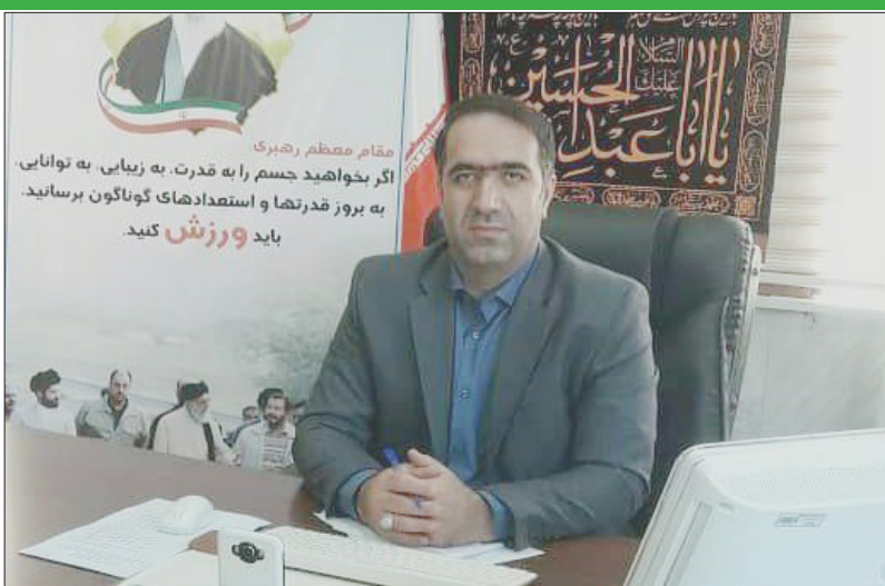
مقام معظم رهبری اگر بخواهید جسم را به قدرت، به زیبایی، به توانایی، به بروز قدرتها و استعدادهای کوناگون برسانید باید ورزش کنید.