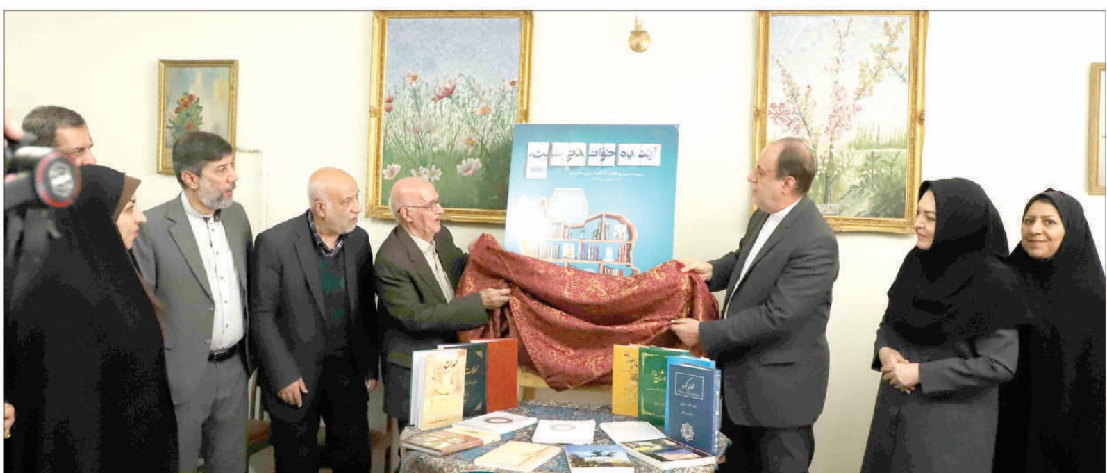
با هدف تجلیل از یک عمر تلاش نویسنده همدانی