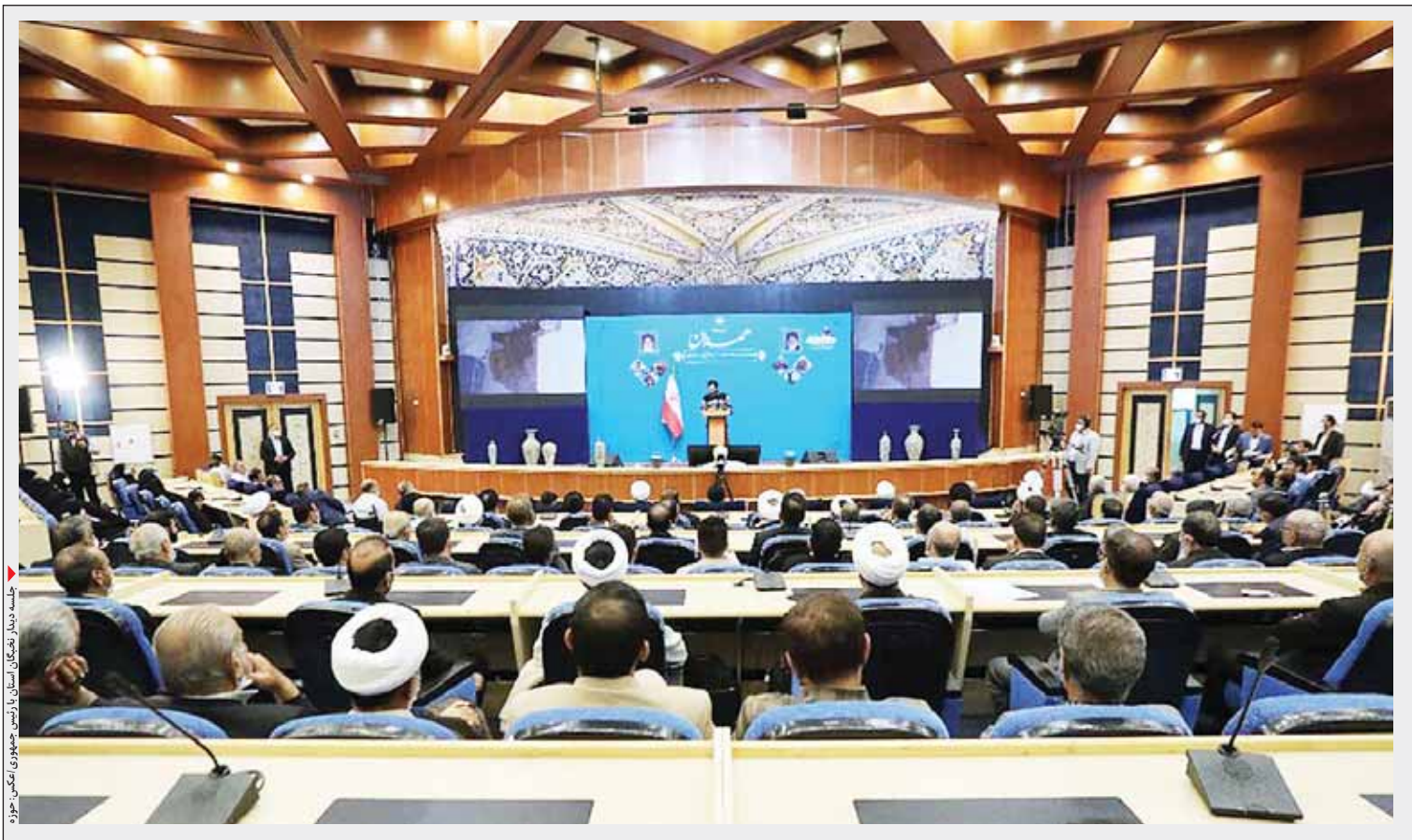
جلسه دیدار نخبگان استان با رئیس جمهوری