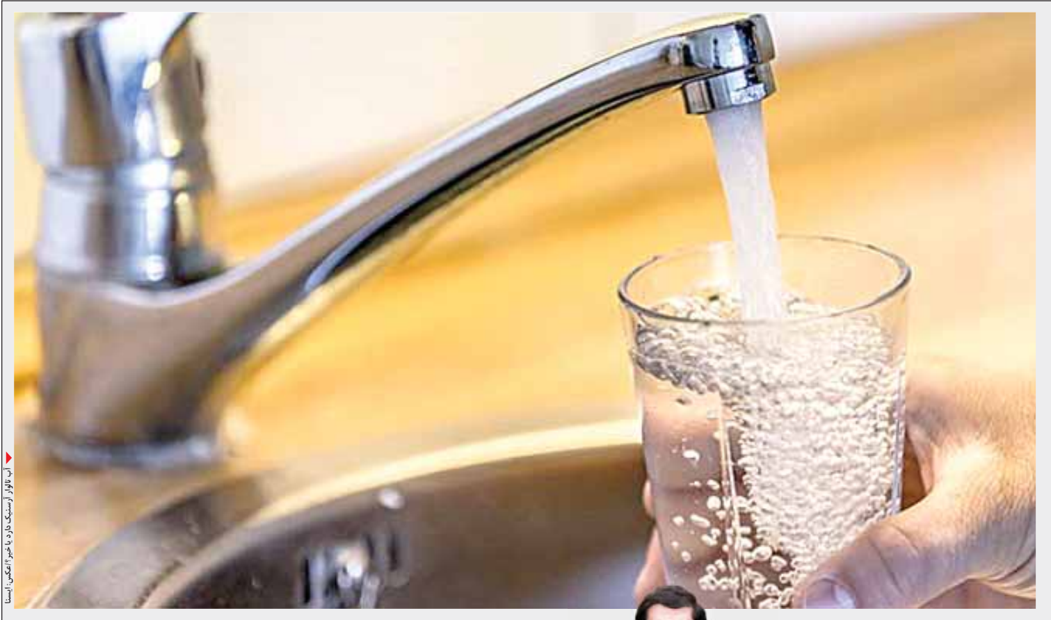
آب تالوار آرسنیک دارد یا خیر؟