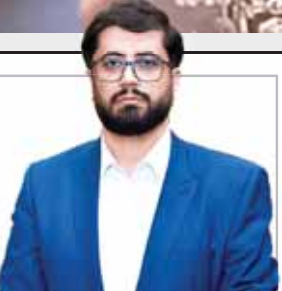
مدیرعامل شرکت گاز استان

اگرچه حوزه های مربوط به آب رسانی در تلاش هستند تا بتوانند در کمترین زمان ممکن مشکل کمبود و بی آبی شهر همدان را حل کنند اما با شنیدن صحبت های مردم و نگرانی های آن‌ها نسبت به سلامت آب هنوز به طور کامل رفع نشده است و جواب قانع کننده ای در این باره از سوی مسئولان دریافت نشده است. همچنان به دنبال راهکار مناسبی برای حل مشکل سلامت آب همدان هستند.