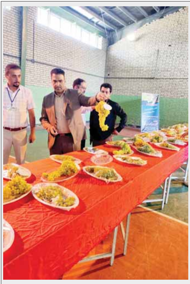
نمایشگاه انگور در سطح ملی و حتی بین المللی است.

ریحیمی، سلامت خوشه، رسیدگی و درسد قند، درشتی و یکنواختی حبه ها، شکل و فرم خوشه، رنگ و وزن را مالک های داری خوشه برتر عنوان کرد.