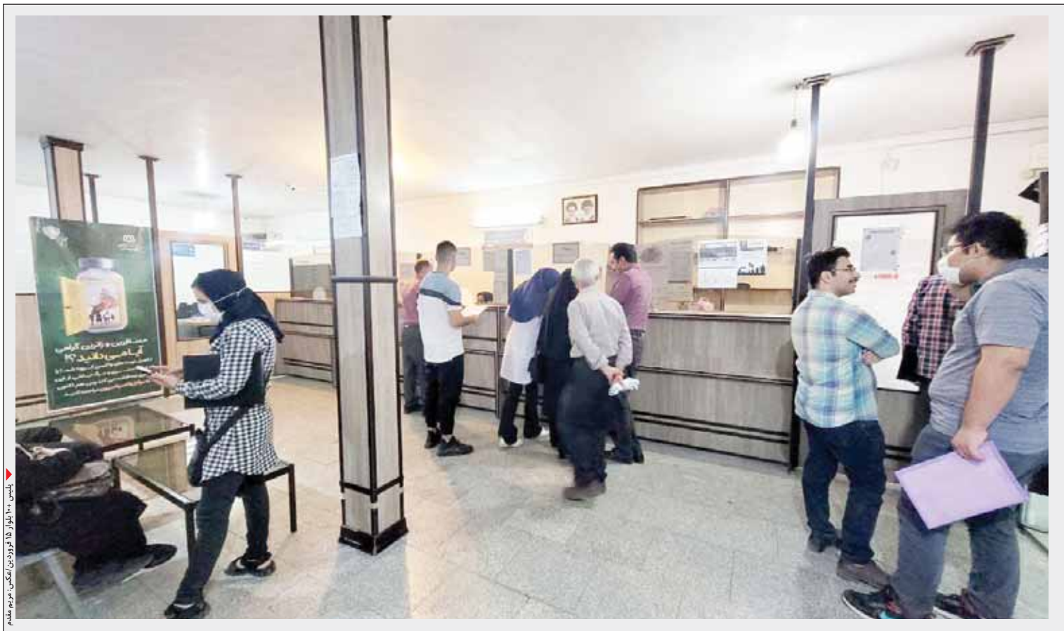
تیم پشتیبانی در حال پاسخگویی به مراجعین در مرکز خدمات

مردم برای تمدید گذرنامه به مرزها مراجعه نکنند