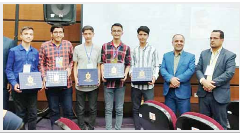
درخشش دانش آموز همدانی در جشنواره خوارزمی همدان

۲- پس از اینکه تمامی بخش های موتور از قبیل جعبه دنده، رادیا تور، فرمان، گیربکس، سلیندر و پیستون را تهیه کردم و هر بخش را در قسمت مربوطه جای گذاری کردم و پس از ساخت تمامی بخش های دستگاه قطعات بدست آمده را به کمک چسب و لچم و پیچ و مهره بهم مونتاژ کردم و بر روی صفحه قرار دادم؛ در نهایت موتور ساخته شد.