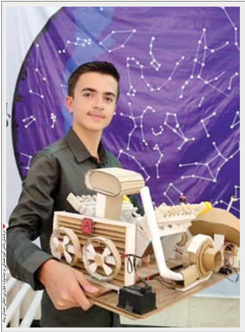
درخشش دانش آموز همدانی در جشنواره خوارزمی همدان

این موتور در لوازم کشاورزی، ماشین های مسابقه ای، قایق هاو ... به کار می رود. این موتور می تواند جایگزین موتورهای تک سیلندر شده و پیشرانه قوی تری نسبت به موتورهای تک سیلندر داشته باشد و حتی می توان روی این موتور یک جعبه دنده ۶ سرعته گذاشت.