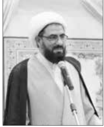
آزمونه کسب و کار در کشور معرفی شود.

رئیس شورای اسلامی شهر همدان نیز در این مراسم ایجاد فرهنگسرای کسب و کار در این شهر را موجب توانمندسازی و ارتقاء سطح مهارت‌های شغلی دانست و گفت: همدان باید به عنوان