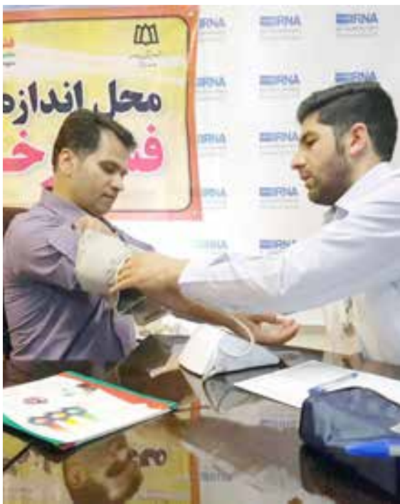
طرح ملی کنترل فشار خون