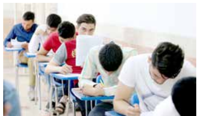
تب تکویر فرونشست