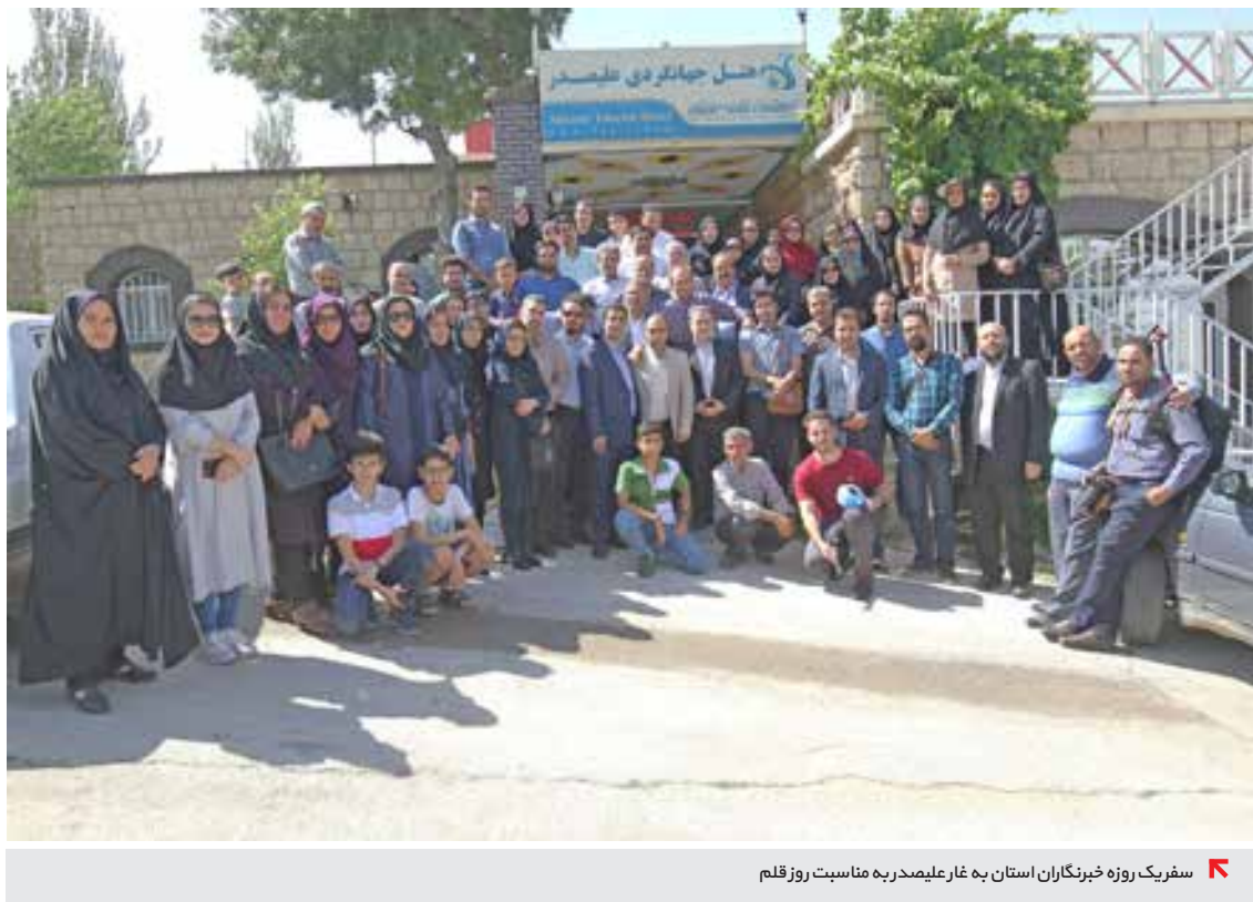
سفریک روزه خبرنگاران استان به غار علیصدر به مناسبت روز قلم