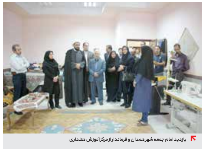
بازدید امام جمعه شهر همدان و فرماندار از مرکز آموزش هنرداری