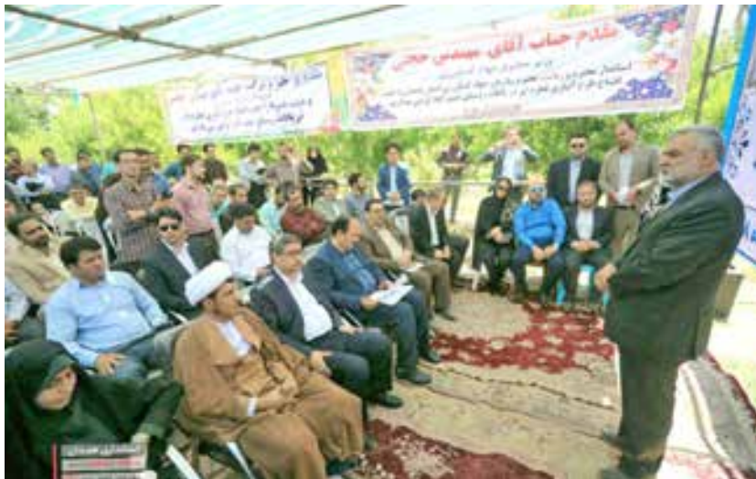
سفر وزیر جهاد کشاورزی به اسدآباد