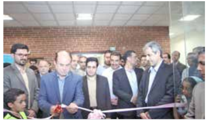
راه اندازی فرهنگسرای کسب و کار ولایت در کوی خضر