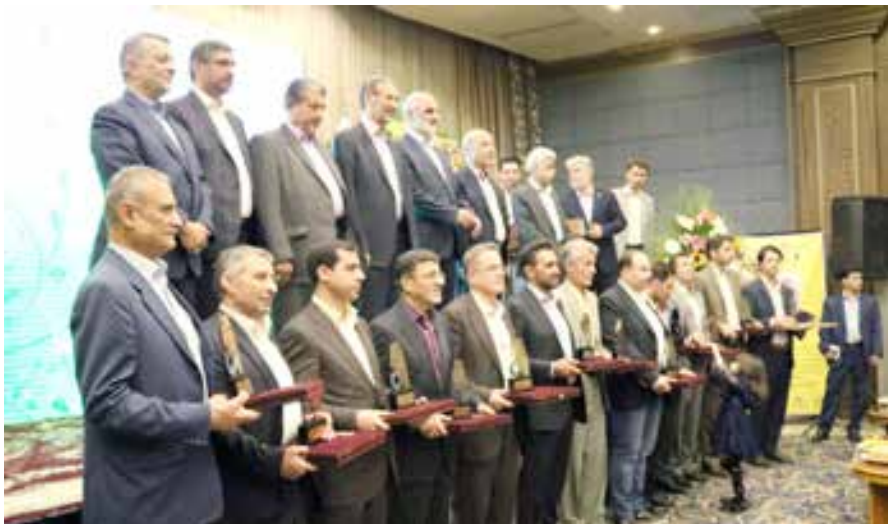
تجزیل از صادرکنندگان نمونه