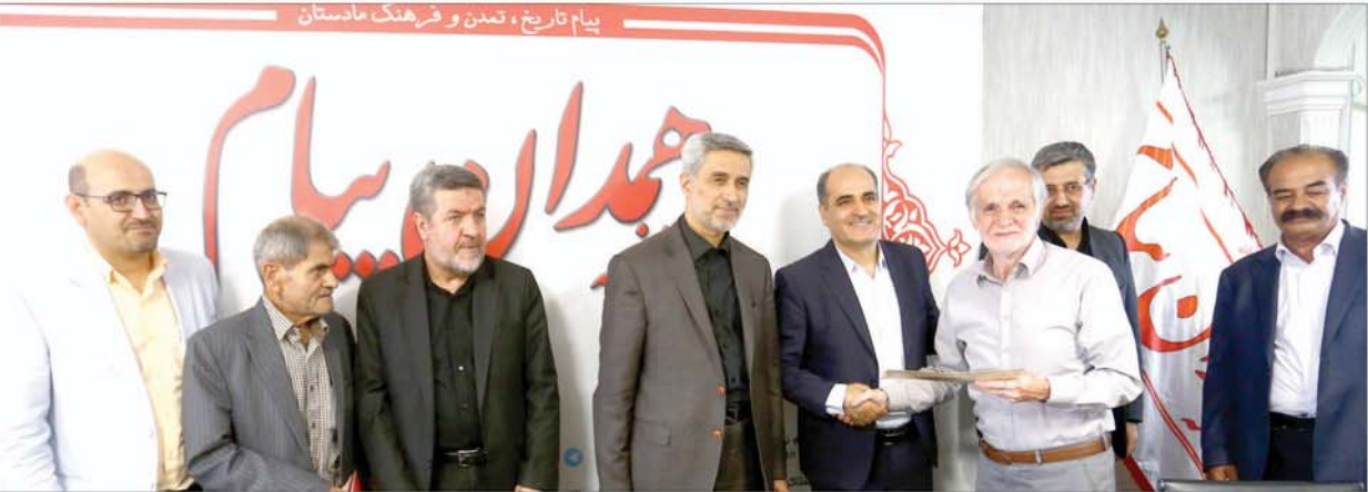
پیام تاریخ، تمدن و فرهنگ مادستان