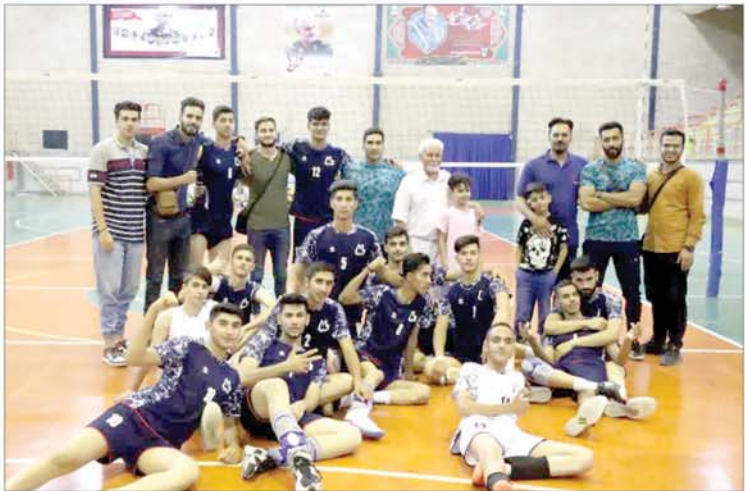
دست جوانان بلندقامت از رسیدن به عنوان کوتاه ماند