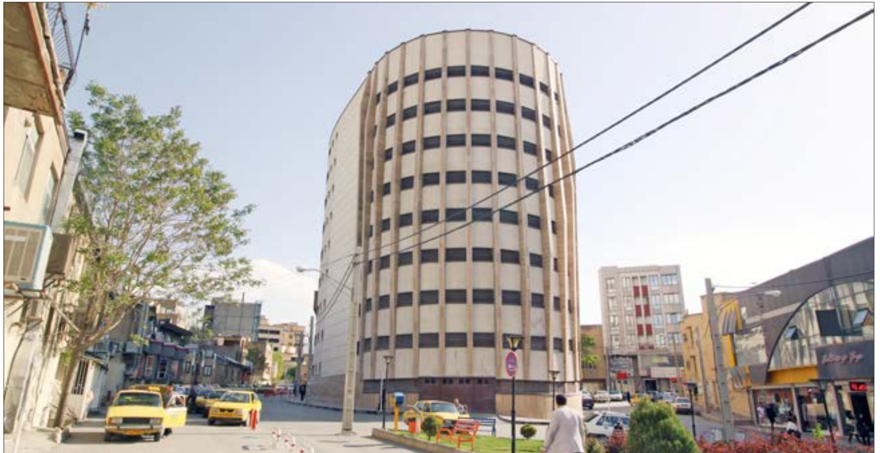
پارکینگ میهنی سینا