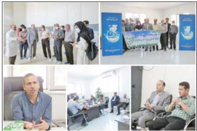
مدیرعامل شرکت آب منطقه‌ای استان همدان از پر بودن بیش از ۹۰ درصد ظرفیت اکثر سدهای استان خبر داد.

وی در ادامه به توزیع ناعادلانه منابع اعتباری اشاره کرد و افزود: برای رونق تولید، حل مشکلات اقتصادی و جلوگیری از مهاجرت باید منابع اعتباری عادلانه بین واحدهای تولیدی علی‌بخشی در ادامه گفت: واحد ما در بدو تاسیس تنها پنیر آب‌نمکی را به صورت نیمه صنعتی تولید