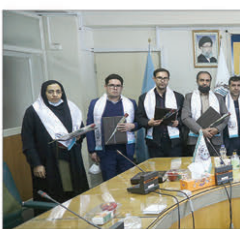
مراسم اعزام کارشناسان رسمی دادگستری استان همدان به مراکز تخصصی قضایی در تهران.

مراسم اعزام کارشناسان رسمی دادگستری استان همدان به مراکز تخصصی قضایی در تهران، روز شنبه ۱۳ آذرماه در محل دادگستری استان همدان برگزار شد. در این مراسم، ۱۰ عضو جدید تحلیف شدند و با ۲۴۰ کارشناس رسمی دادگستری استان همدان، فعالیت رسمی خود را آغاز کردند. این کارشناسان در مراکز تخصصی قضایی در تهران، در زمینه‌های مختلف قضایی، از جمله رسیدگی به پرونده‌های کیفری، حقوقی، خانواده و امور اطفال، فعالیت خواهند کرد. این کارشناسان در مراکز تخصصی قضایی در تهران، در زمینه‌های مختلف قضایی، از جمله رسیدگی به پرونده‌های کیفری، حقوقی، خانواده و امور اطفال، فعالیت خواهند کرد.