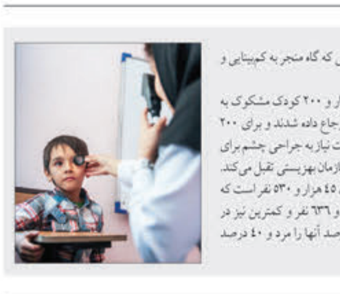
درمانی نمی‌توان از پیشرفت اختلالات بینایی که گاه منجر به کم‌بینایی و نابینایی می‌شود، جلوگیری کرد.

بازگشت مردم همدان به عرصه‌های کار و تلاش و زندگی