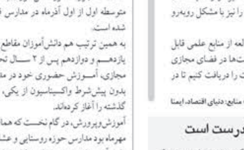
آموزش و پرورش، در گام نخست که همان اول مهرماه بود مدارس حوزه روستایی و عشایری، دانش‌آموزان فنی و حرفه‌ای و کار و دانش را بازگشایی کردند و نیمه آبان‌ماه هم کلاس‌های درس دانش‌آموزان متوسطه دوم حضوری شد.

حالا هم اعلام کرده‌اند که ۱۳۱ هزار و ۲۹۸ دانش‌آموز ابتدایی و متوسطه اول راهی مدرسه می‌شوند.