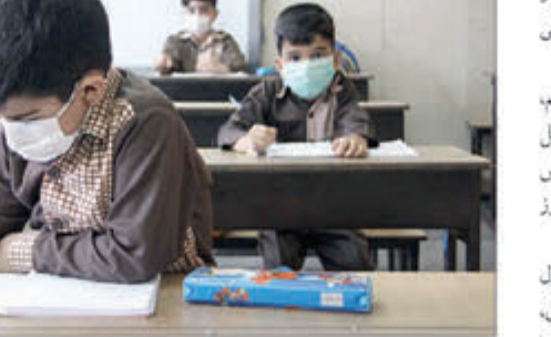
آموزش و پرورش، در گام نخست که همان اول مهرماه بود مدارس حوزه روستایی و عشایری، دانش‌آموزان فنی و حرفه‌ای و کار و دانش را بازگشایی کردند و نیمه آبان‌ماه هم کلاس‌های درس دانش‌آموزان متوسطه دوم حضوری شد.

حالا هم اعلام کرده‌اند که ۱۳۱ هزار و ۲۹۸ دانش‌آموز ابتدایی و متوسطه اول راهی مدرسه می‌شوند.