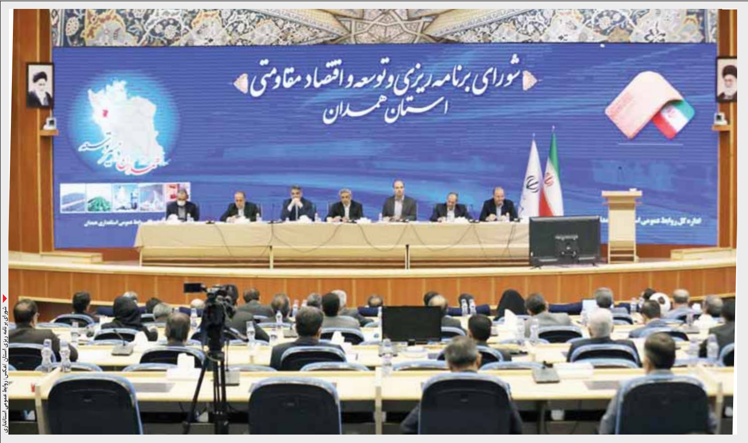
شورای برنامه‌ریزی توسعه و اقتصاد مقاومتی استان همدان. رئیس‌جمهور استان، سید محمد هاشمی، در جلسه شرکت کرده است.

■ در شورای برنامه‌ریزی از همراهی کشاورزان تقدیر شد