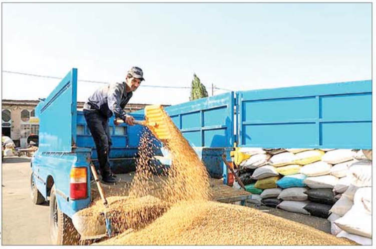
مدیرکل دفتر غلات و محصولات اساسی وزارت جهاد کشاورزی: