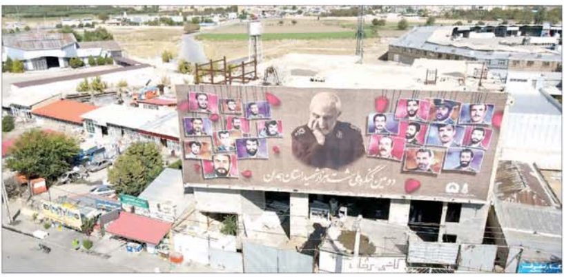
رئیس سازمان فرهنگی، اجتماعی و ورزشی شهرداری همدان با بیان اینکه شهرداری همدان با همکاری سایر نهادهای دولتی و غیردولتی، اقدامات ارزشمندی در برگزاری کنگره هشت هزار شهید استان همدان داشته است.