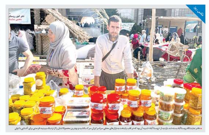
دختران در حال خوردن غذاهای سنتی در یک جشنواره فرهنگی و تفریحی در استان همدان.