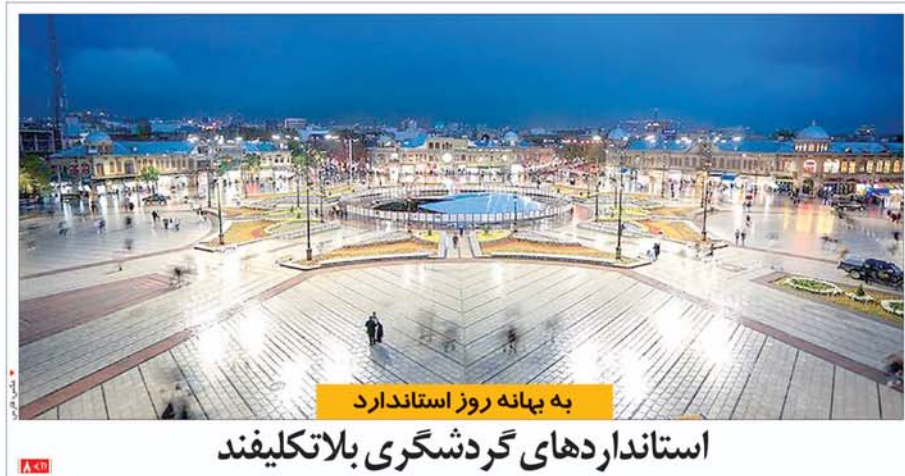
به بهانه روز استاندارد