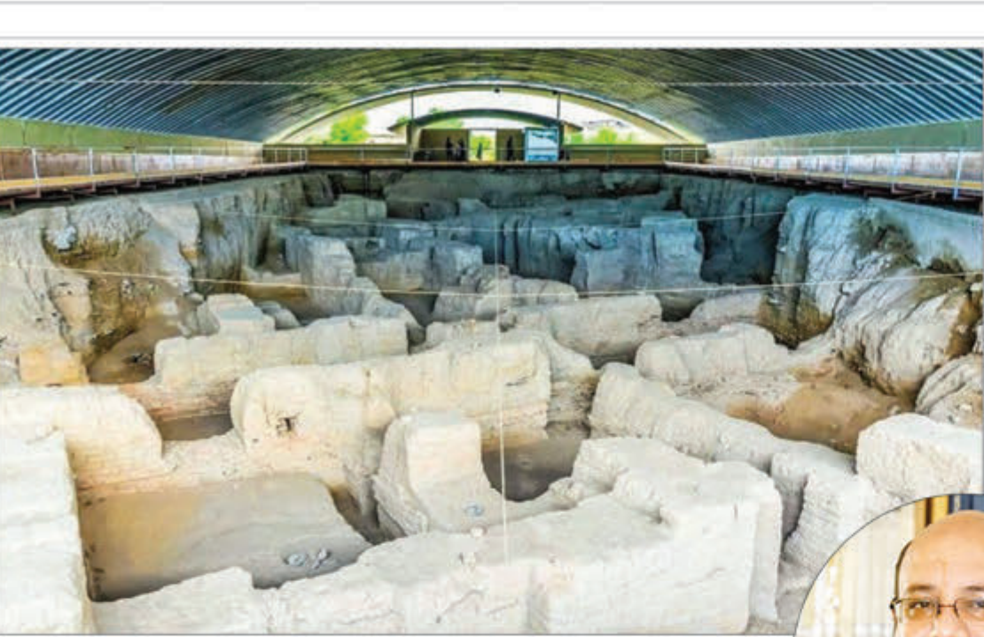
عرض ۳۵ متر و پی بندی آجری در بخش وسیعی از تپه گسترش داشته و جهت شمال شرقی به جنوب غربی دارند.