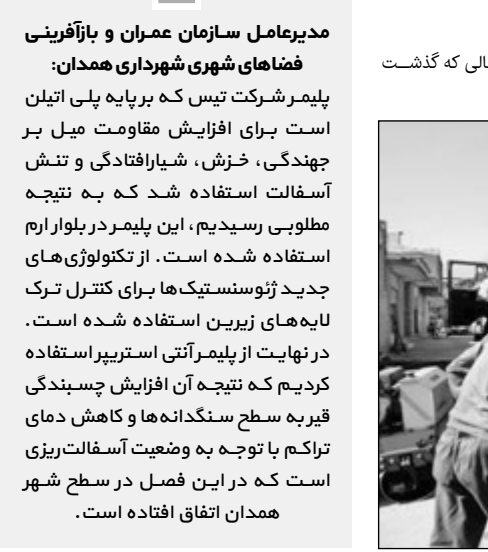
لکه گیری آسفالت با دستگاه فلاسک

○ استفاده از تکنولوژی جدید صباغی با بیان این‌که در سالی که گذشت