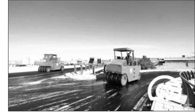
آسفالت پل سردرآمد همدانی

از دوپلیمر برای بهبود کیفیت آسفالت استفاده کردیم، توضیح می‌دهد: پلیمر شرکت تیس که بر پایه پلی‌اتیلن اسرت برای افزایش مقاومت میل بر چهندگی، خزش، شیارافتادگی و تنش آسفالت استفاده شد که به نتیجه مطلوب رسیدیم. این پلیمر در بلوار ارم استفاده شده است. از تکنولوژی‌های جدید ژئوسنتتیک‌ها برای کنترل ترک لایه‌های زیرین استفاده شده است. در نهایت از پلیمر آنتی استریپر استفاده کردیم که نتیجه آن افزایش چسبندگی قیر به سطح سنگدانه‌ها و کاهش دامای تراکم با توجه به وضعیت آسفالت‌ریزی است که در این فصل در سطح شهر همدان اتفاق افتاده است. وی می‌افزاید: ما سه دستگاه فلاسک در سطح شهر داریم که آسفالت را در دمای تولید بدون این‌که با محیط تبادل حرارتی داشته باشد نگهداری می‌کند و دستگاه کاتر گلنکزن برای ترمیم آسفالت نیز داریم. با توجه به این‌که نیمه دوم سال سرد است طبیعتاً به فکر این بودیم که بتوانیم در برودت وضعیت جوی کیفیت آسفالت خود را ارتقا دهیم. دو پلیمر دیگر در دستور کار ما قرار دارد یکی ادتیو پودر لاستیک که در دست برداری است. بهبود کیفیت آسفالت با استفاده از وسامتیر به اضافه پودر پلاستیک و استفاده از رستپلاست که امیدواریم خزش آسفالت و افزایش مقاومت را کنترل کنیم.