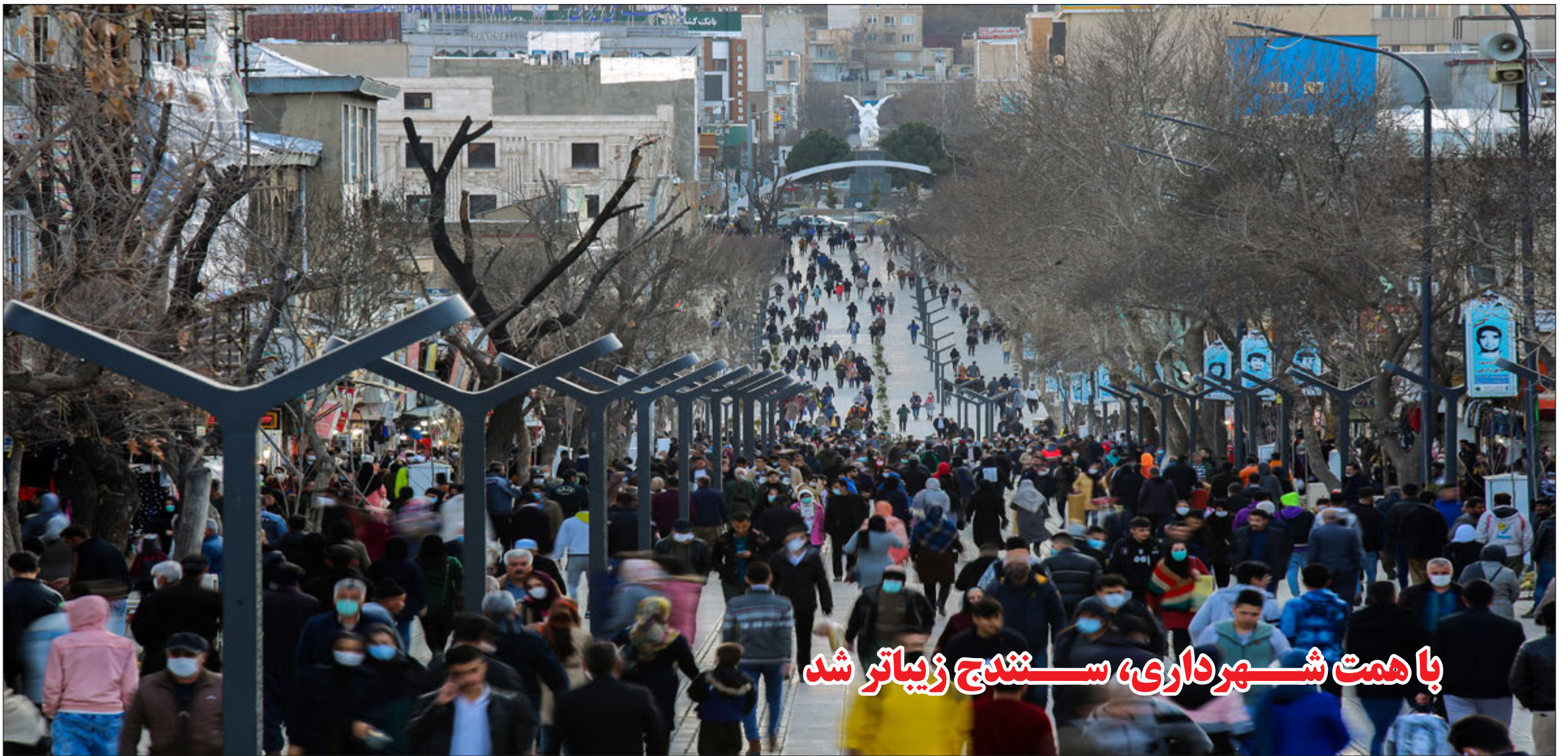
با همت شهرداری، سهندج زیباتر شد