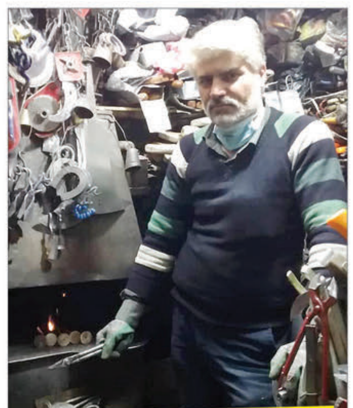
پس از ورود محصولات بی‌کیفیت چینی به بازار، صنایع‌دستی در حال نابودی است

حاج‌حاضر رونق آنچنانی ندارد و به علت حمایت نداشتن، در حال نابودی است. در حال حاضر ما ۲۰ درصد از محصولاتمان را تولید می‌کنیم و بقیه آنها را به عنوان فروشنده، به فروش می‌رسانیم، در حالی که در گذشته همه محصولات را خودمان تولید می‌کردیم و در طول روز ما کار می‌کردیم. ولی در حال حاضر بیشتر وسایل باغبانی و آشپزخانه‌ای، و رستورانی همچون قیچی، اره، چاقو، کاره، ساپور و گاهی نیز ابزارهای سفالگری و خراطی و فرش‌بافی را نیز تولید می‌کنیم.