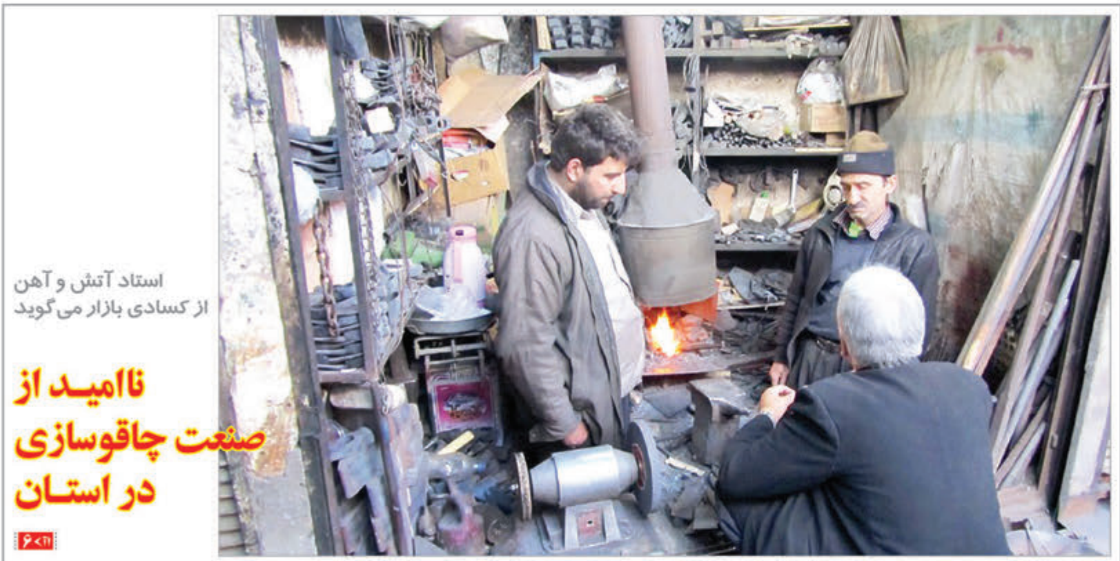
استاد آتش و آهن از کساد بازار می‌گوید