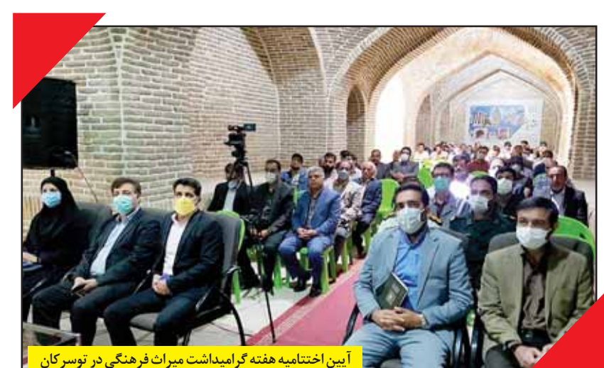
آیین اختتامیه هفته گرامیداشت میراث فرهنگی در توسرکان