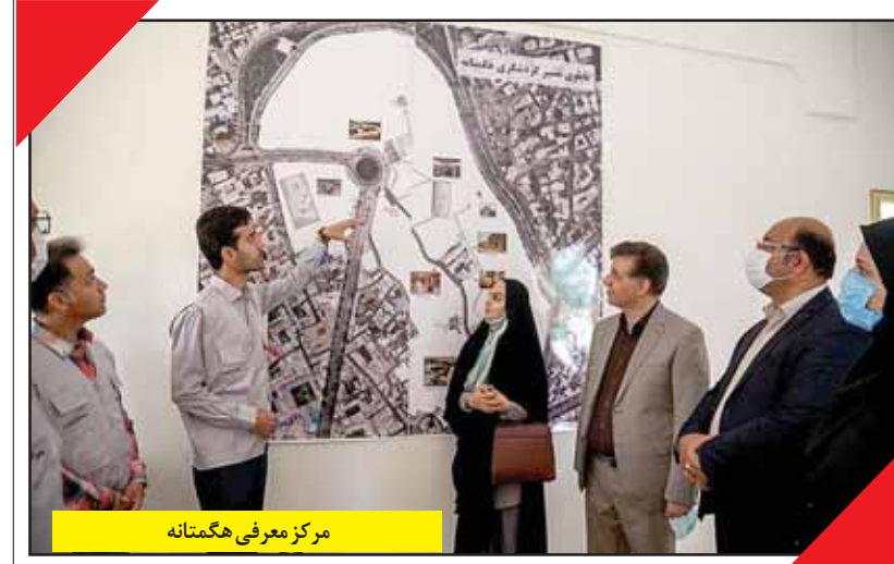
مرکز معرفی هگمتانه