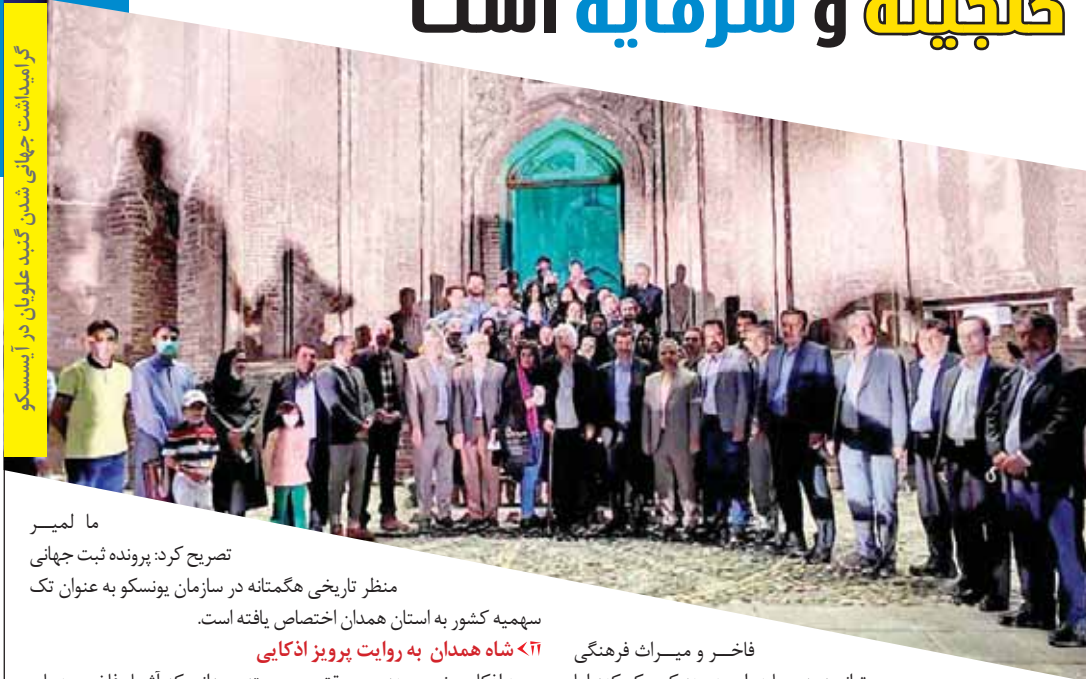
گرامیداشت جهانی شدن گنبد علویان در ایسکو

گنبد علویان به همراه اثر دیگر از کشورمان، در جمع آثار میراث جهانی اسلام در بهمن ماه ۲۰۰۰ قرار گرفت. در زمان یادشده ۵