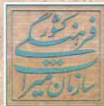
معاونت میراث فرهنگی