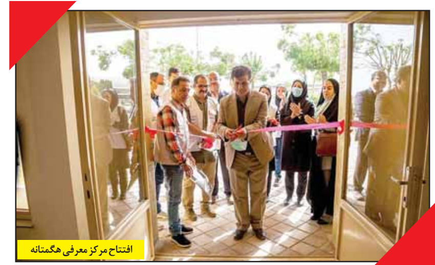
افتتاح مرکز معرفی هگمتانه