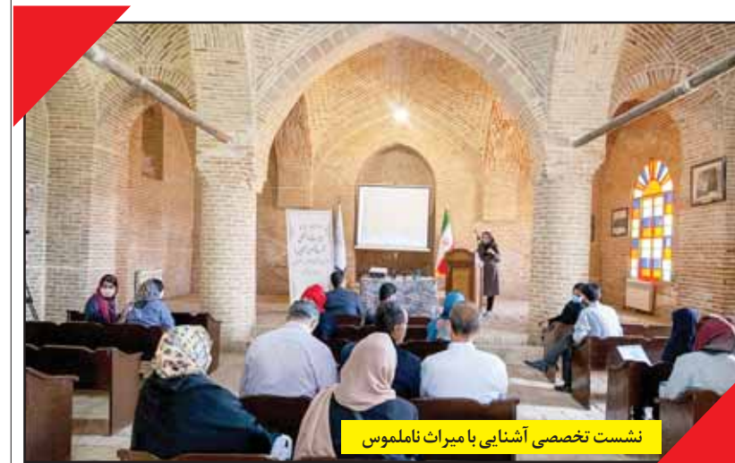
نشست تخصصی آشنایی با میراث ناملموس