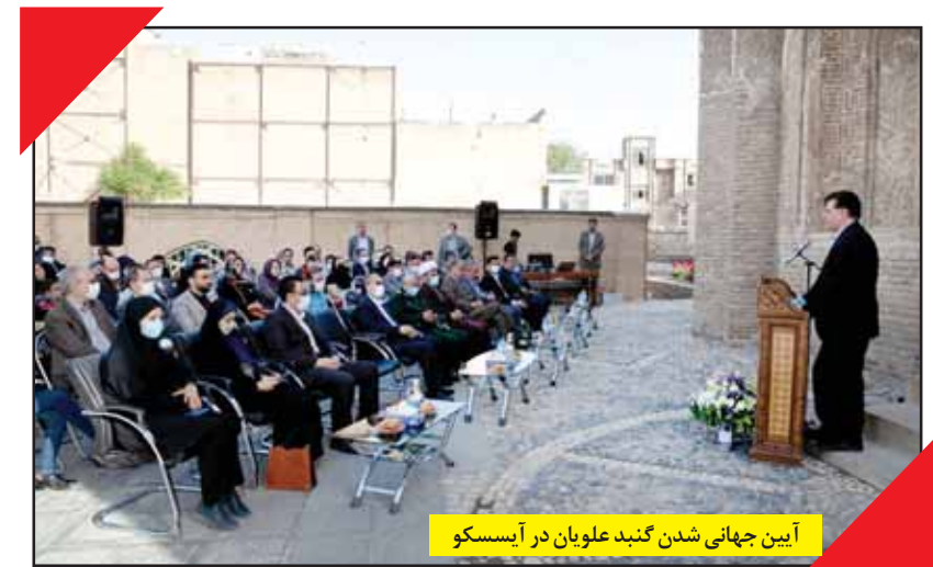
آیین جهانی شدن گنبد علویان در آیسسکو