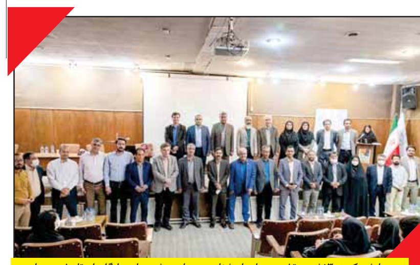
همایش یکروزه ۳ نشست تخصصی باستان شناسی، معماری و شهرسازی پایگاههای تاریخی همدان