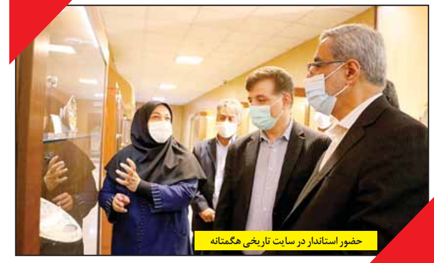
حضور استاندار در سایت تاریخی هگمتانه