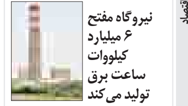
نیروگاه مفتح ۶ میلیارد کیلووات ساعت برق تولید می‌کند