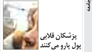
پزشکان قلبی پول پارو می‌کنند