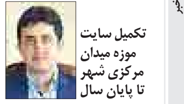
تکمیل سایت موزه میدان مرکزی شهر تا پایان سال