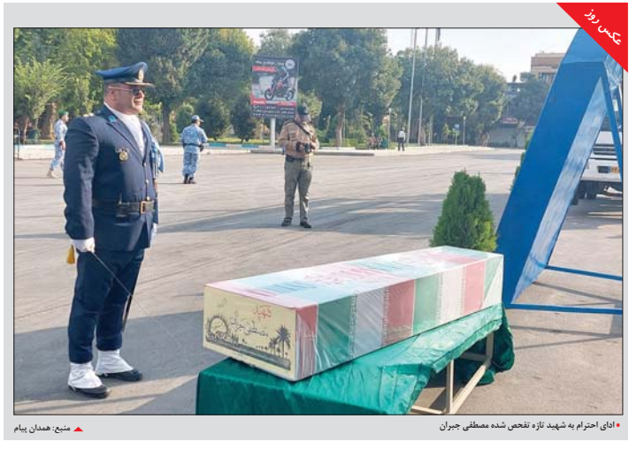
ایای احترام به شهید تازه تفحص شده مطهری جویان

کانون پرورش فکری کودکان و نوجوانان رزن به ۱۶ روستای محروم رزن و درگزین خدمات‌رسانی می‌کند.