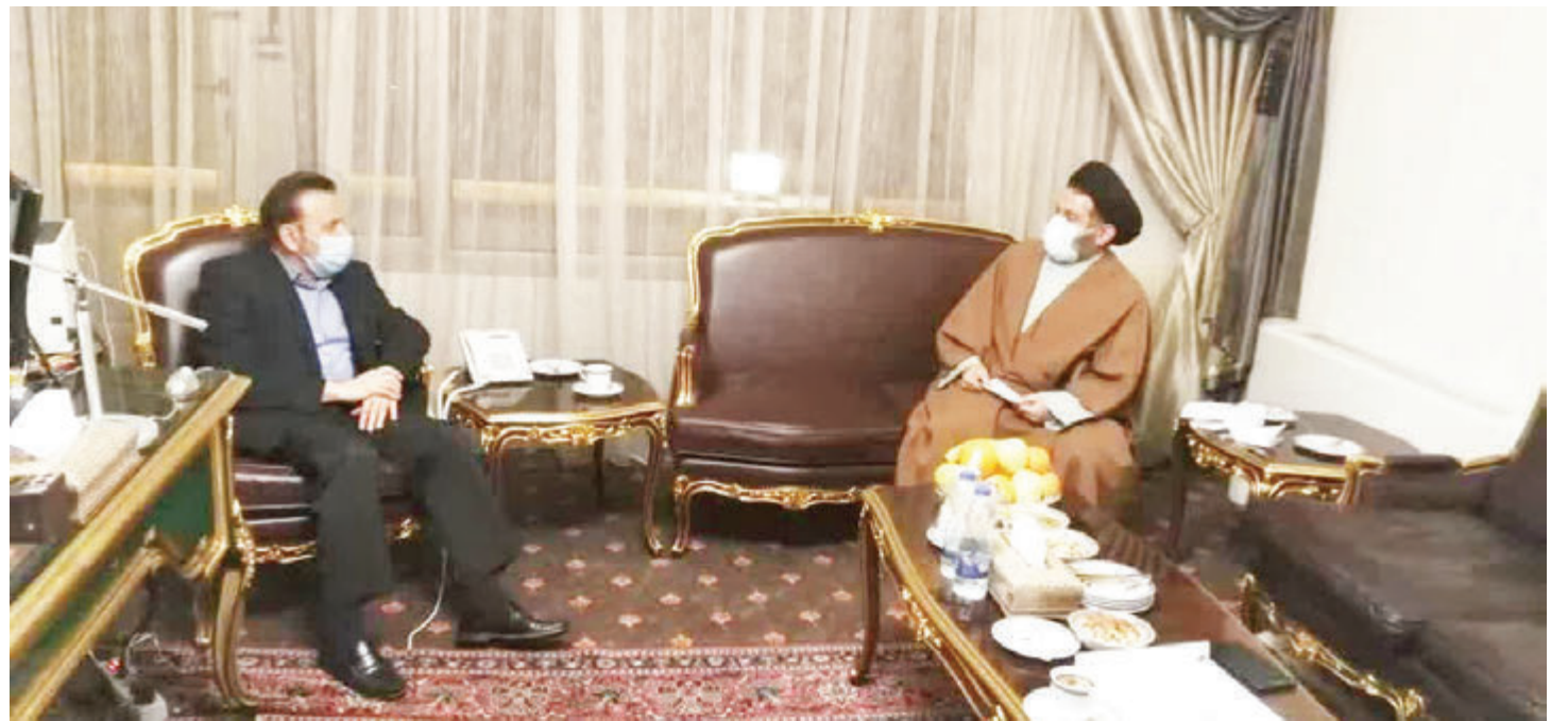
حجت الاسلام شاهرخی در دیدار با رییس دفتر رییس جمهور مطرح کرد: