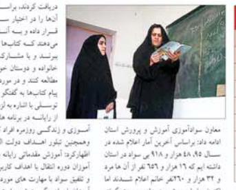
معان سوادآموزی آموزش و پرورش استان