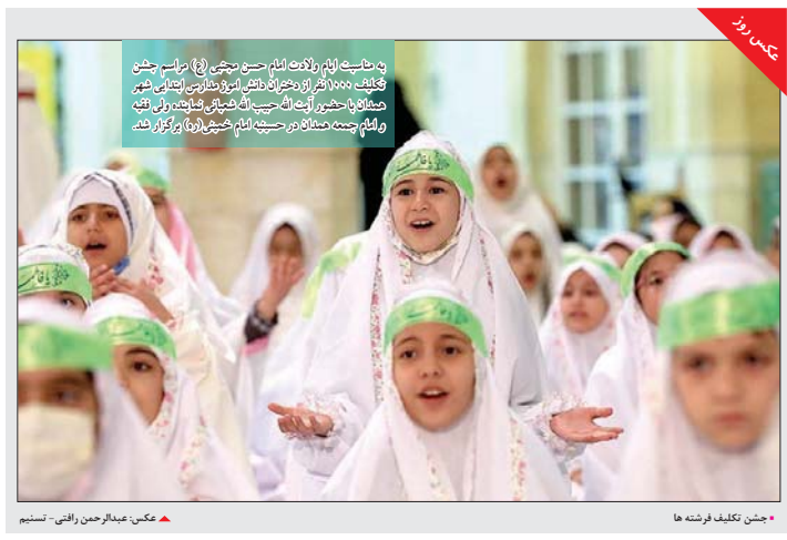
چشم تکلیف فرشته ها...

مهم فارابی در نگاه فلسفی است... فیلسوف را به صرف فیلسوف بودن شایسته در دست گرفتن مقدرات جامعه نمی‌داند