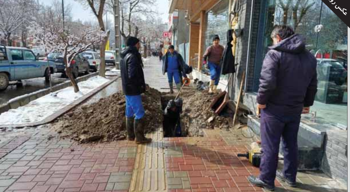
پیاده‌روی به یک ماه پیش باسازی شده بود بار دیگر حفاری شد