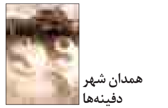
همدان شهر دقیقه‌ها