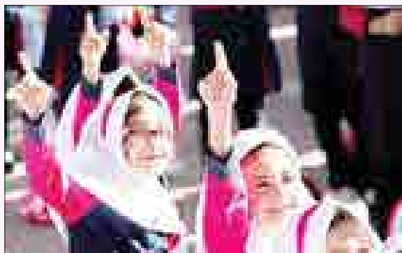
تحت نظارت وزارت کشور به اجرا در آمده است.

در پایان تجری از ۸۰۰ امام جماعت فرهنگی که از کارکنان و بانکنشینان فرهنگی می‌باشند، یاد کرد و خواستار این شد تا از زحمات بی‌مزد آنها قدردانی و تشکر به عمل آید.