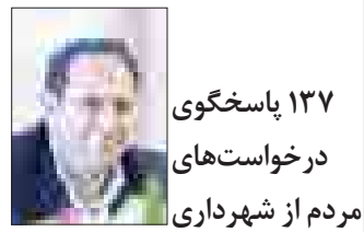
۱۳۷ پاسخگوی درخواست‌های مردم از شهرداری