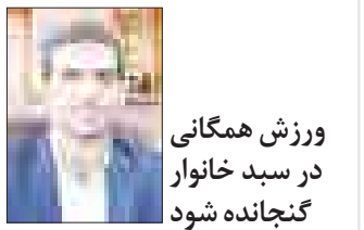
ورزش همگانی در سید خانوار گنجانده شود