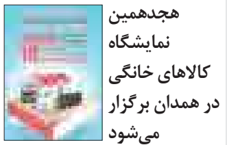
هجدهمین نمایشگاه کالاهای خانگی در همدان برگزار می‌شود