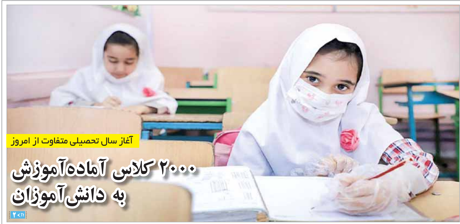
آغاز سال تحصیلی متفاوت از امروز

نماینده ولی فقیه در استان: بلوار شهدای سلامت، جهادی ساخته شد