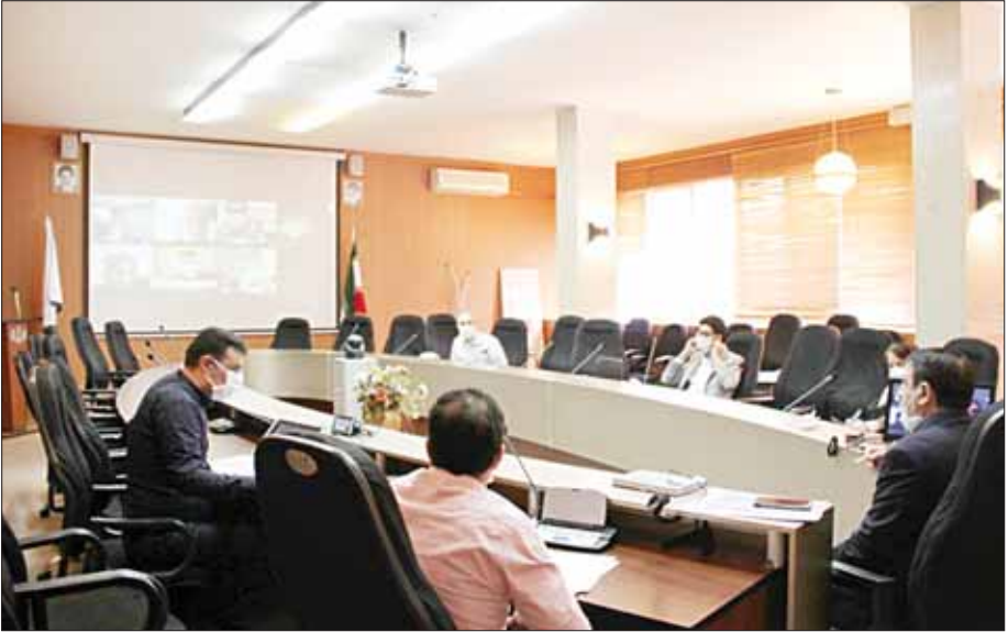
تصویر نمایشی است