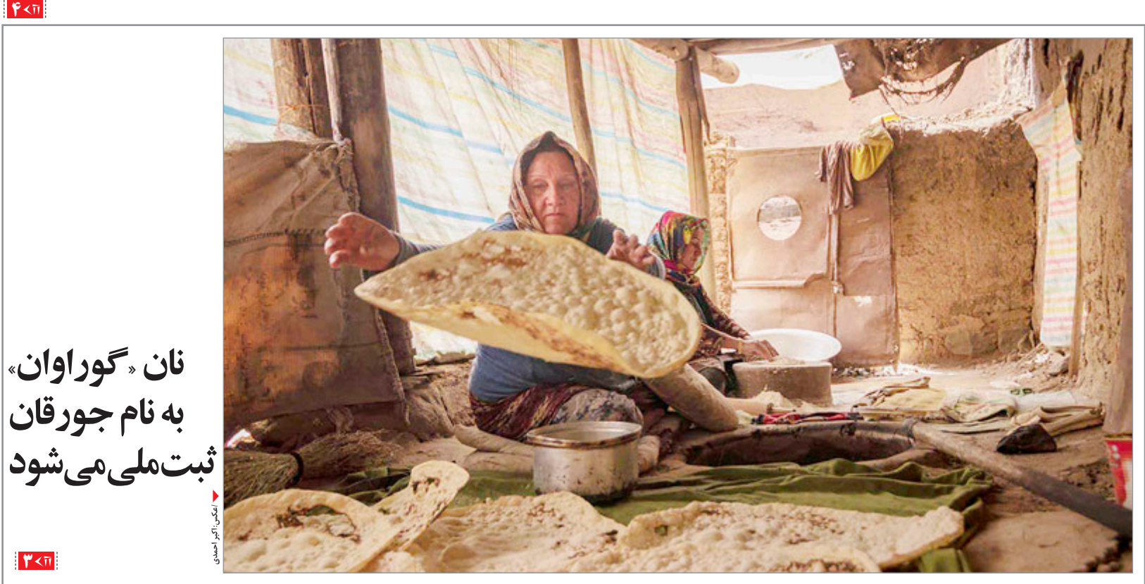
نان «گوراوان» به نام جورقان ثبت ملی می‌شود